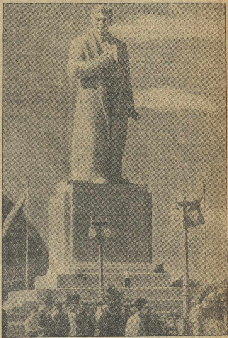
Всесоюзная сельскохозяйственная выставка. Монумент И. В. Сталина, установленный перед павильоном «Механизация».

Председательствующий — депутат Андреев А. А. оглашает перечень вопросов, внесенных на рассмотрение внеочередной Четвертой Сессии Верховного Совета СССР.