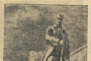
Всесоюзная сельскохозяйственная выставка. Скульптура «Пограничник» в павильоне «Дальний Восток».

на постоянную работу: секретари-машинистка и картотечники. Обращаться: г. Горький, ул. Лядова, 13. 25237