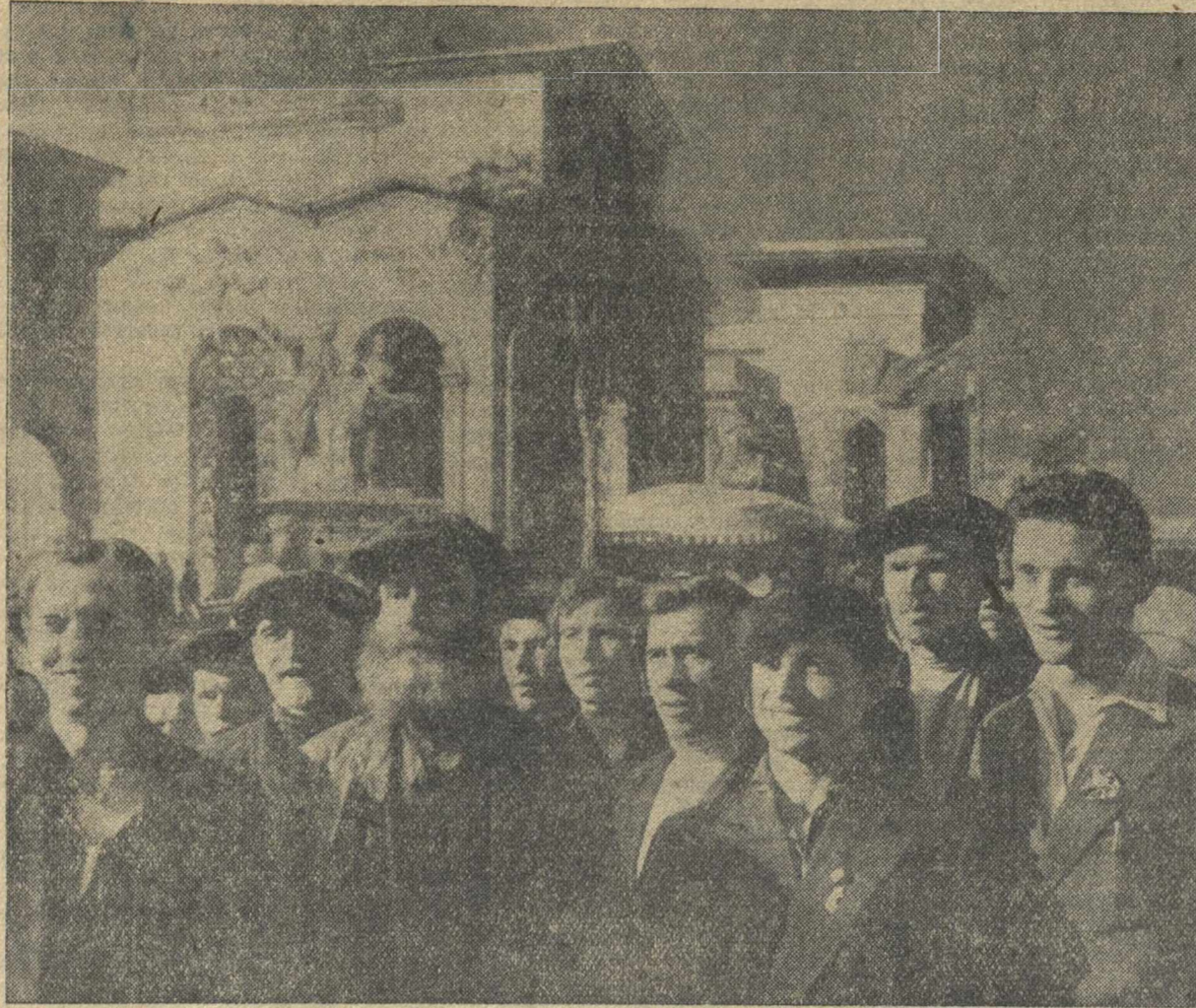
Всесоюзная сельскохозяйственная выставка. Экскурсанты — колхозники Борского района нашей области на площади Колхозов.

это время 13,65 метра со скоростью от 16 до 22 метров в час. 25 электродвигателей помогли электроблокам сдвинуть громадное здание с места. Дальше движение осуществлялось двумя электроблоками. Здание двигалось по 18 четырехрельсовым путям. Нормальный рабочий день в Московском совете и Московском областном исполнительном комитете не нарушался. Здание Московского совета было двинено на новое место. Инженеры, техники, рабочие и служащие собрались во внутреннем дворе на митинг. Участники передвижки здания приветствовали председателя Московского совета тов. Пресина. Он поздравил коллектив с успешным окончанием работы. Вечером у председателя Моссовета состоялся прием лучших стахановцев и ударников, посвященный завершению работ по передвижке здания Московского совета. (ТАСС.)