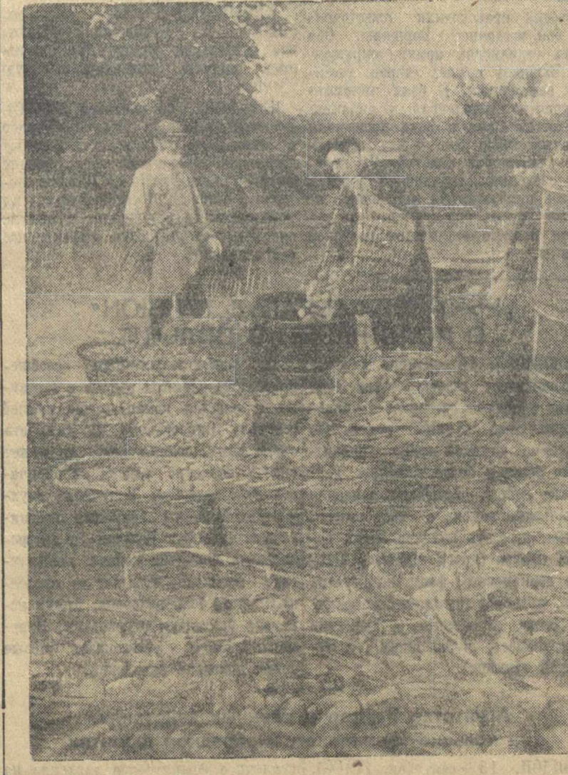
Засолочный пункт Печерского колхоза им. Калинина за первые 4 дня работы засалил 7 тонн огурцов. (Всего намечено засолить по 20 тонн). На снимке: промышка огурцов.

Д. ГОЛЛАНД. Дер. Ягодное, Курмышского района.