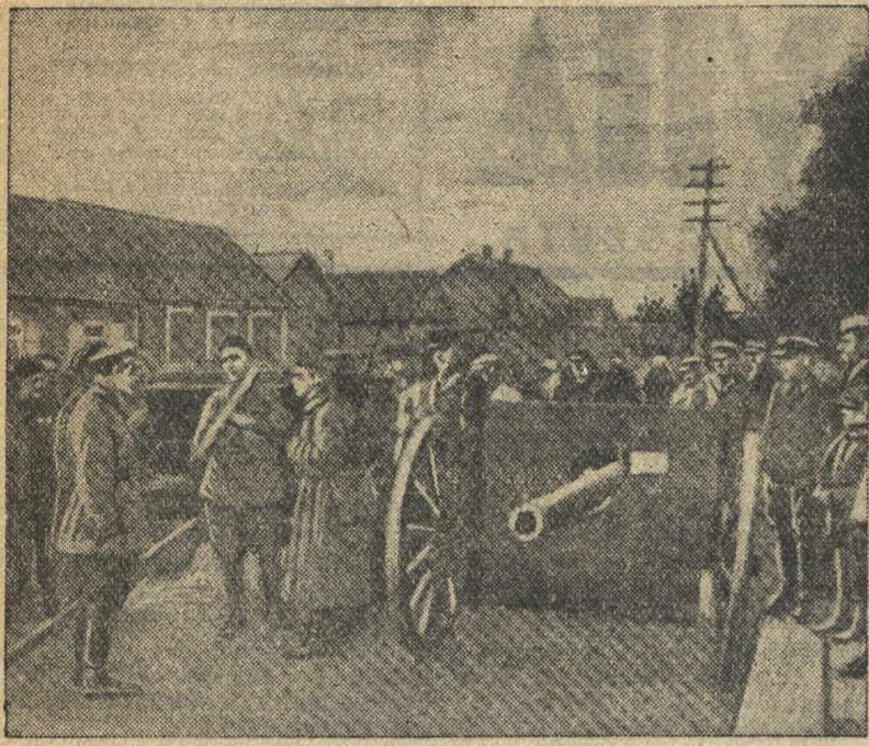
Западная Белоруссия. Боевые трофеи — польские пушки.