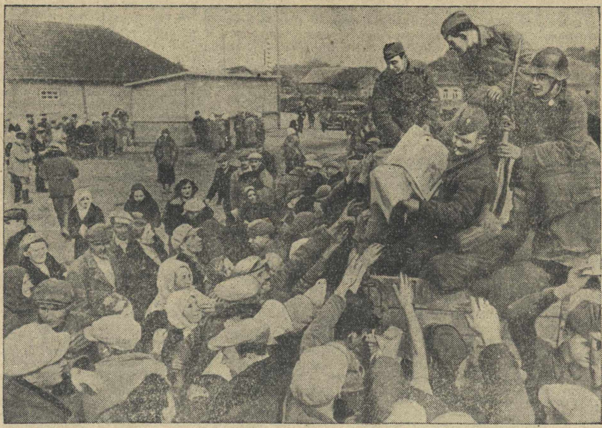
В Западной Белоруссии, вблизи г. Вильно. Бойцы Красной Армии раздают населению свежие московские газеты.

Мировому рабочему классу и трудящимся всех стран ставится все более очевидным, что окончательный мир между народами может быть обеспечен только тогда, когда под знаменем Маркса—Энгельса—Ленина—Сталина рабочий класс победит в важнейших капиталистических странах и осуществит социализм.