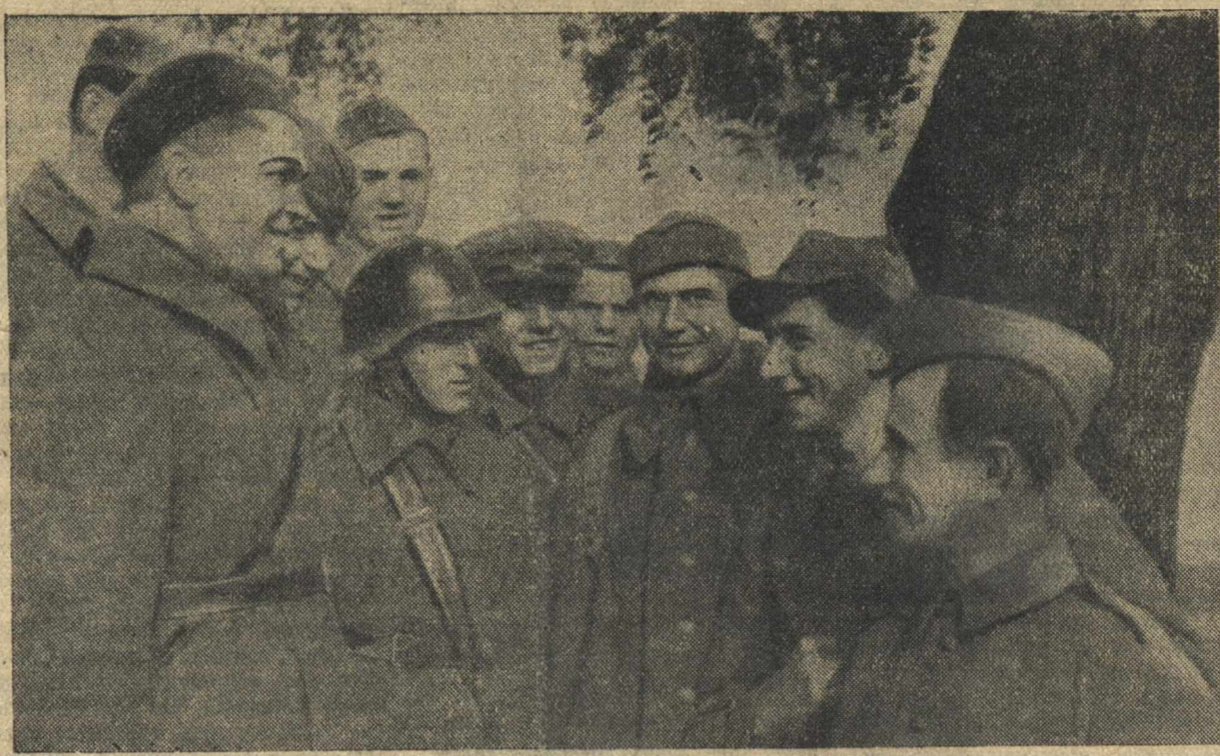
По городам, местечкам и селам Западной Белоруссии. На снимке: красноармейцы беседуют с пленными польскими солдатами.

Славный почин и призыв работников ефремовцев повсеместно найдет горячий отклик во всех колхозах нашей области.