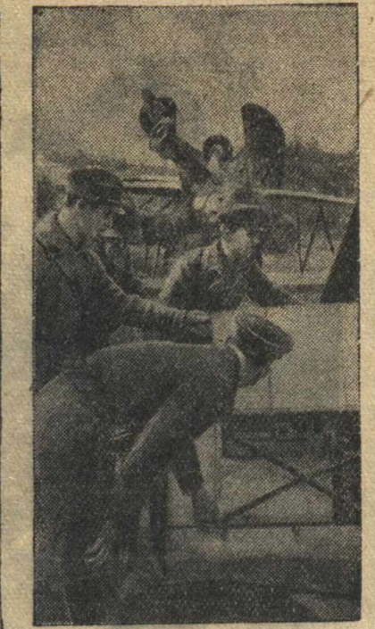
По городам и селам Западной Белоруссии. На снимке: на Виленском аэродроме бойцы рассматривают разбившиеся польские самолеты.