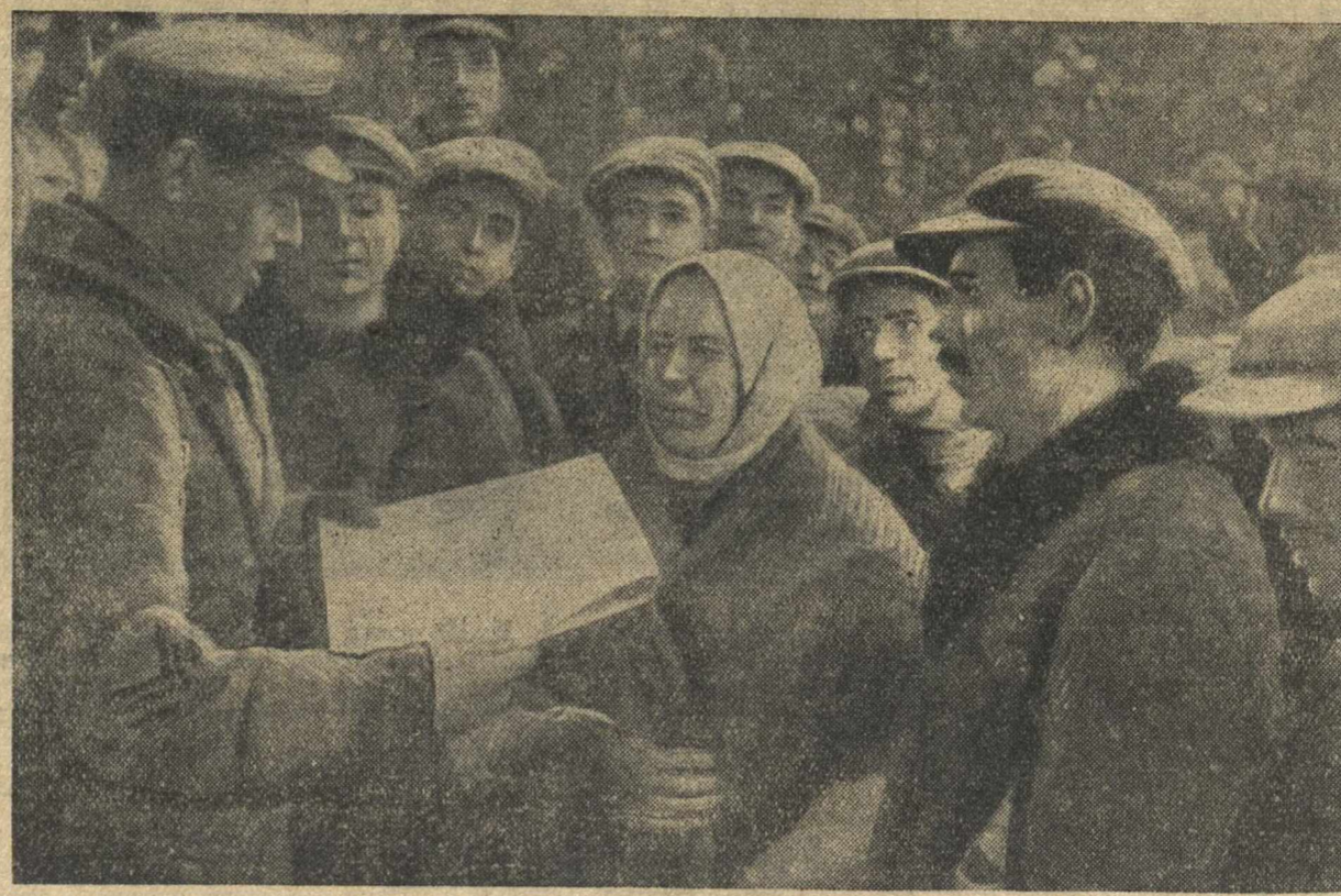
По городам и селам Западной Белоруссии. На снимке: читка газеты крестьянам (в районе Вильно).

ЦК ВКП(б) и СНБ СССР своим постановлением дали партийным и советским организациям боевую программу борьбы за наведение порядка в колхозном землепользовании, за укрепление дисциплины труда, за дальнейшее проведение колхозного строя. Большевистски провести в жизнь это постановление — главная задача всех партийных и непартийных большевиков села.