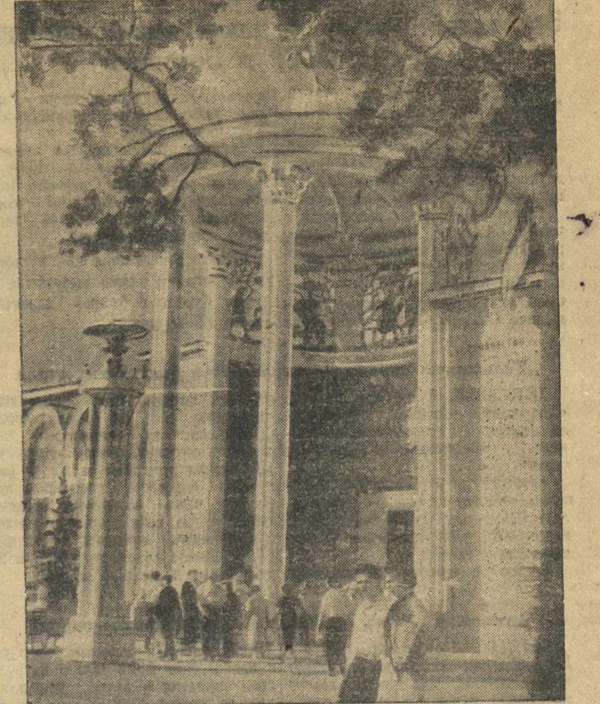
Всесоюзная сельскохозяйственная выставка. Павильон «Охота и звероводство».