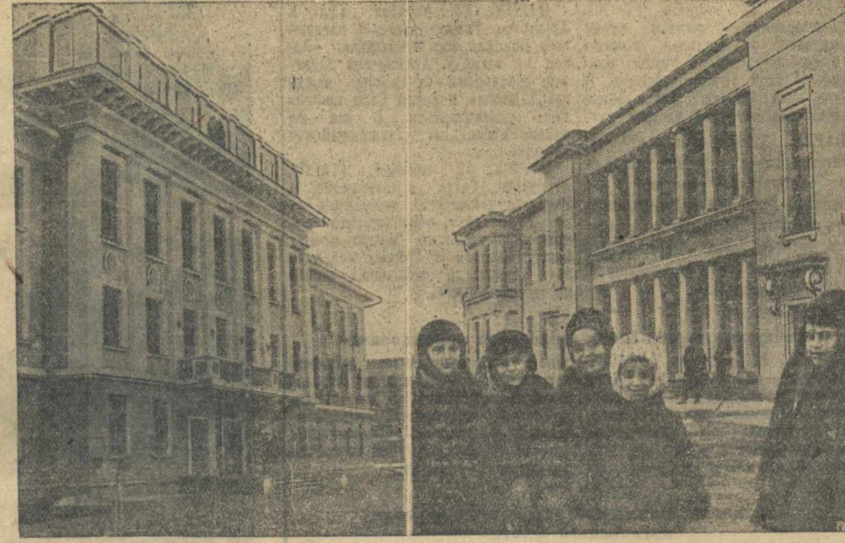
В Соцгороде автозавода им. Молотова. На снимке: Дом Советов и (справа) детский сад № 8.

В домах обновленных поселков: Гнильцы, Монастырка, Карповка, Стахановский — горит электрический свет, жители пользуются водой из городского водопровода. В городе и поселках радиофицировано около 10 тыс. квартир; в этом году радиофицируются Гнильцы, а устроены там почта и телеграф, что позволит провести радио и в Нагуляно, Стригину и Доскинский совхоз. Человек — самый ценный капитал в нашей стране. Заботу советской власти о здоровье трудящихся