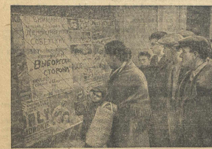
По городам и селам Западной Украины. На снимке: жители гор. Ровно читают афишу о демонстрации первого советского кинофильма «Выборгская сторона».

незабываемые дни. На всех предприятиях и в учреждениях проводятся многолюдные предвыборные митинги. Ежедневно в театрах города проходят большие концерты. В городе уже функционируют 25 кинотеатров. Железнодорожники Львовского узла провели первый коммунистический субботник по восстановлению ж.-д. узла. Здесь с нетерпением ждут прихода с Советской Украины первого советского поезда.