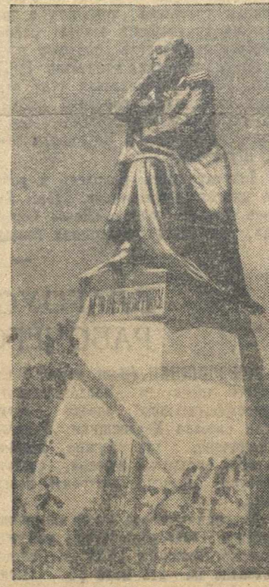
Памятник М. Ю. Лермонтову в Пятигорске.

Восстающая, призывная поэзия Лермонтова в «морской палате» николаевского царствования звучала, как колокол на башне воевой, пробуждая решимость в малодуш-