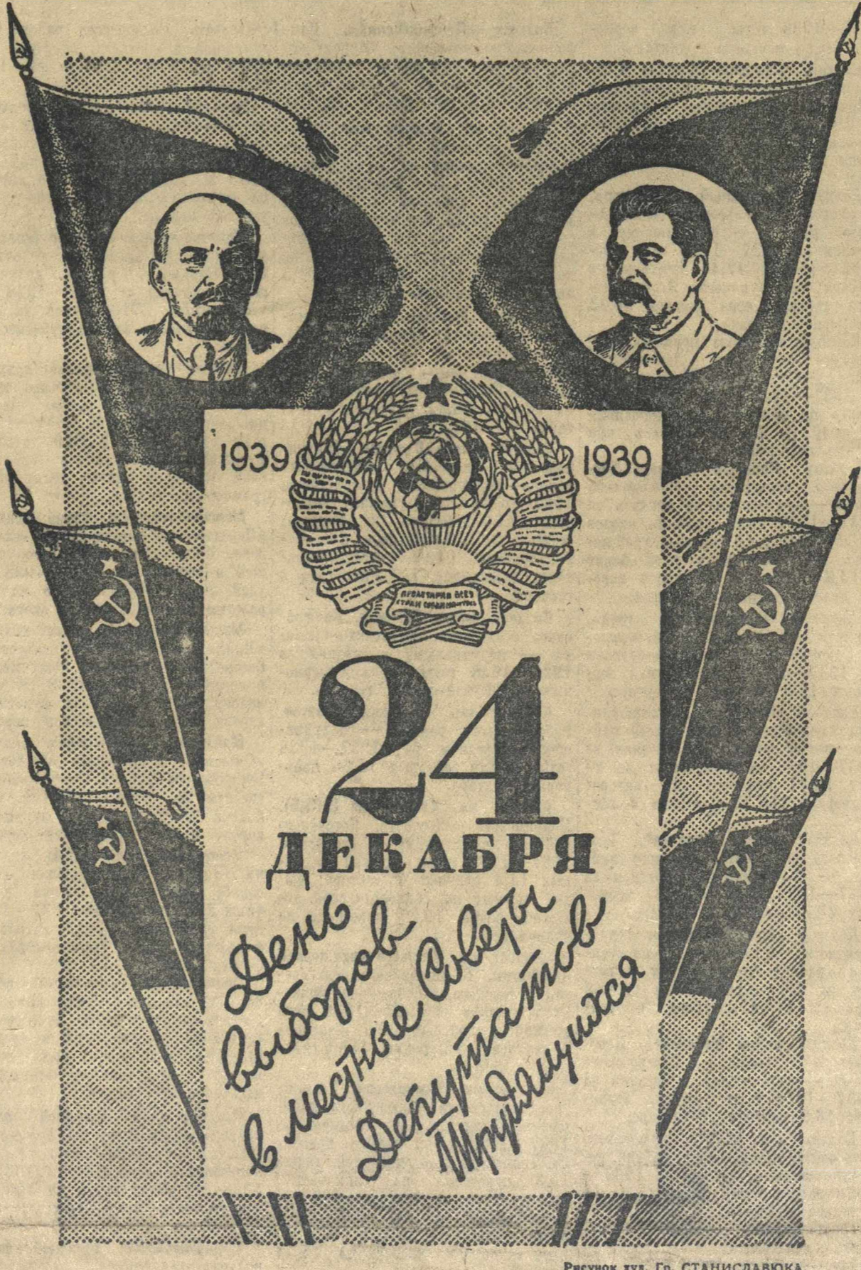
Рисунок худ. Гр. СТАНИСЛАВЮКА.