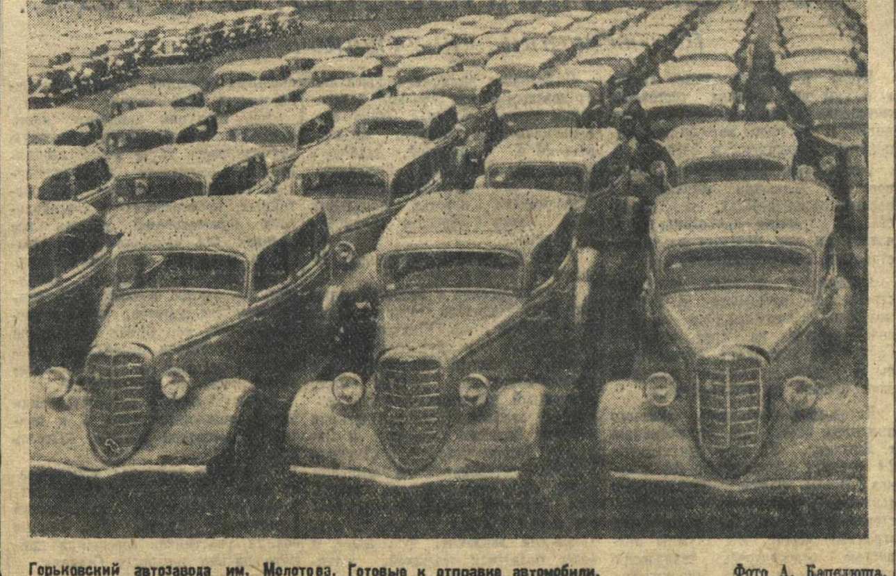
Горьковский автозавод им. Молотова. Готовые к отправке автомобили.