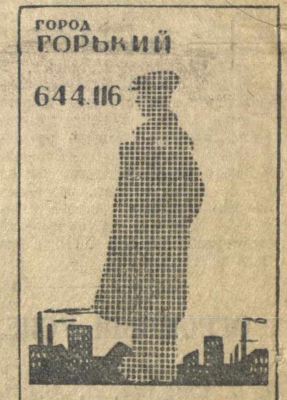
По количеству населения город Горький занимает шестое место в СССР...

С огромным удовлетворением и гордостью горьковчане узнают, что