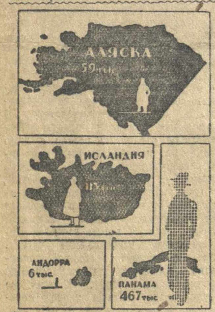
...Население нашего города равно населению Панамы, Исландии, Аляски и Андоры вместе взятых.

В. ЧКАЛОВ. Из беседы со скульптором Менделеевым.