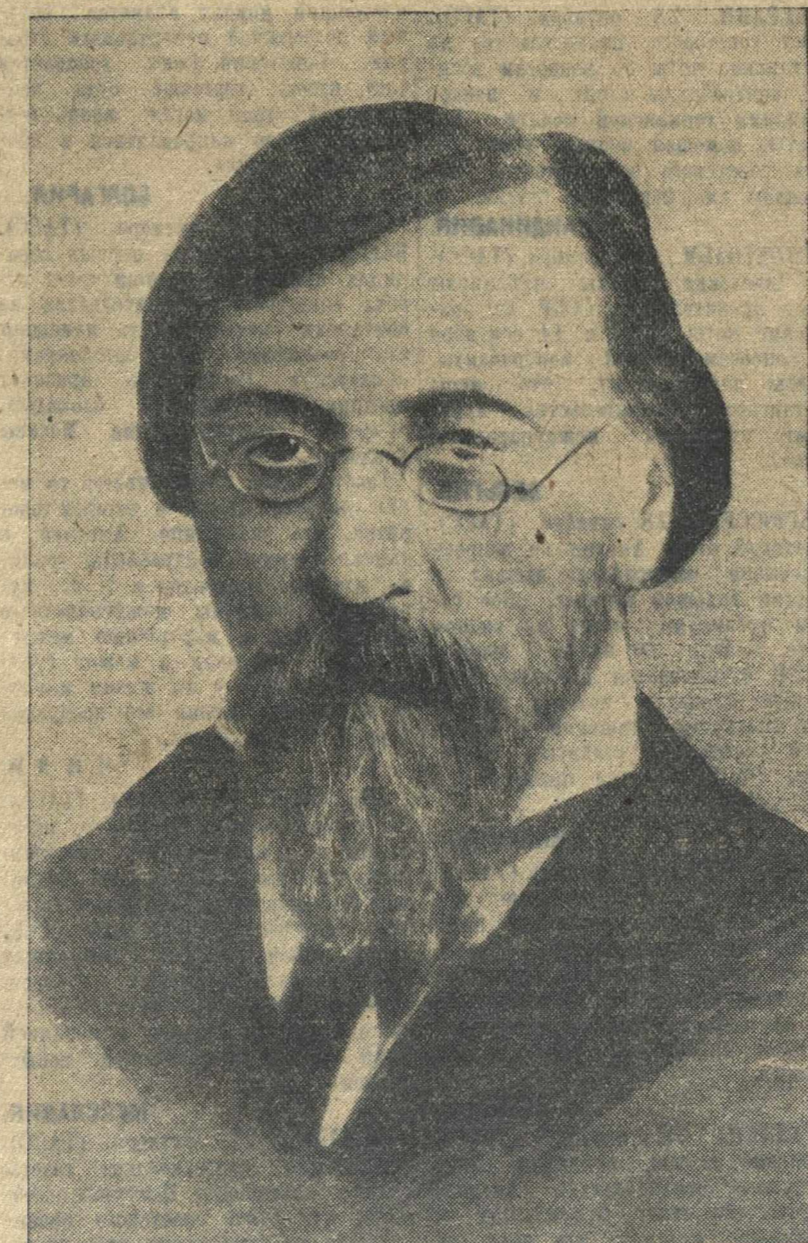
Портрет Н. Г. Чернышевского.

Чернышевский оставил ценнейшее наследство и в художественной литературе. До нас дошли не все его художественные произведения. За годы заключения в Вятку он написал 15 романов, «Обчерки по всеобщей истории» и ряд других