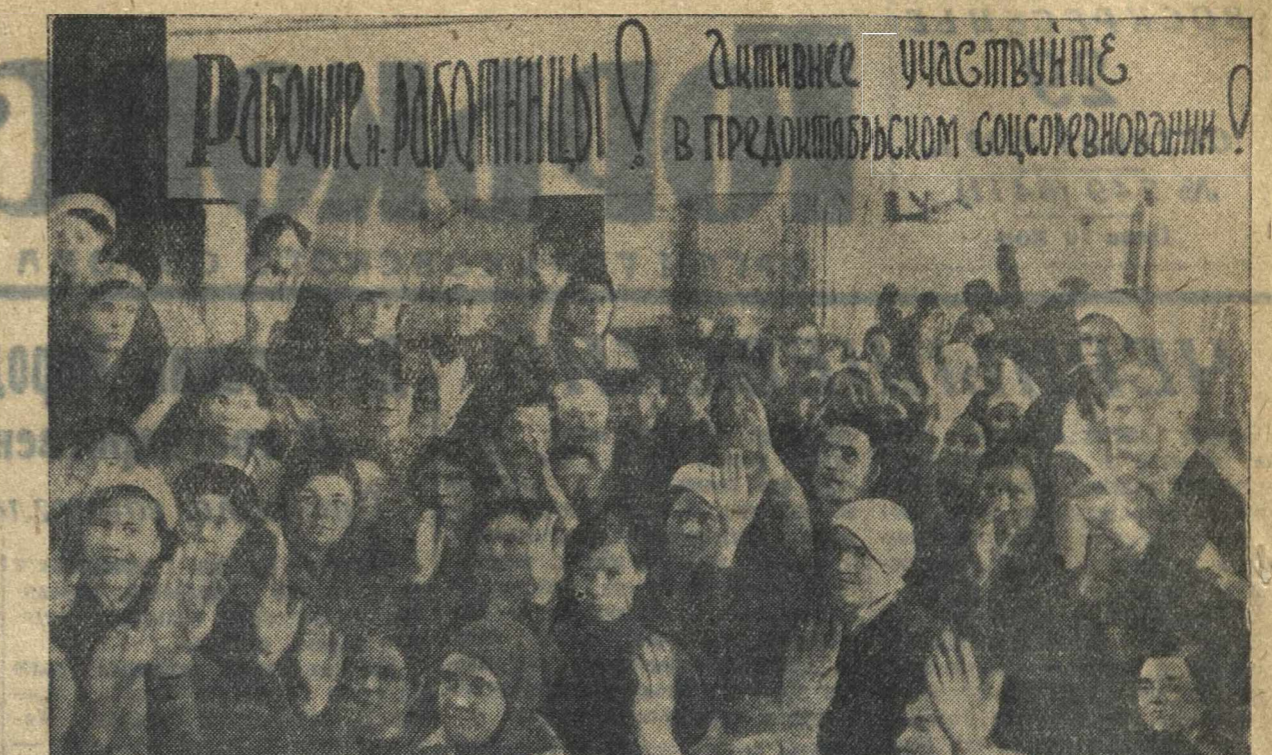
Общее собрание членов профсоюза швейников цеха № 2 швейной фабрики им. Красной армии и флота по выдвижению кандидатур в избирательные комиссии. Фото П. Мозжухина.

опять влететь на наш народ старое помещичье — капиталистическое ярмо. Навсегда кончилось время угнетения и эксплуатации. Так же, как наши братья — народы Советского Союза, вместе с ними будем мы строить свое светлое, свободное, созидательное будущее. Советский Союз — наша любимая Родина, которую мы будем любить любовью верного сына, которую мы будем защищать всей нашей силой. Нам светит Советская Конституция. Мы знаем и славим имя Ее Творца. Слава Творцу самой демократической Конституции в мире, слава Вам, наш мудрый вождь! Ваш гений, гений партии большевиков, указывает нам путь. По этому пути неустанно и радостно будем мы идти к вершинам человеческого счастья! Да здравствует Великий Сталин!