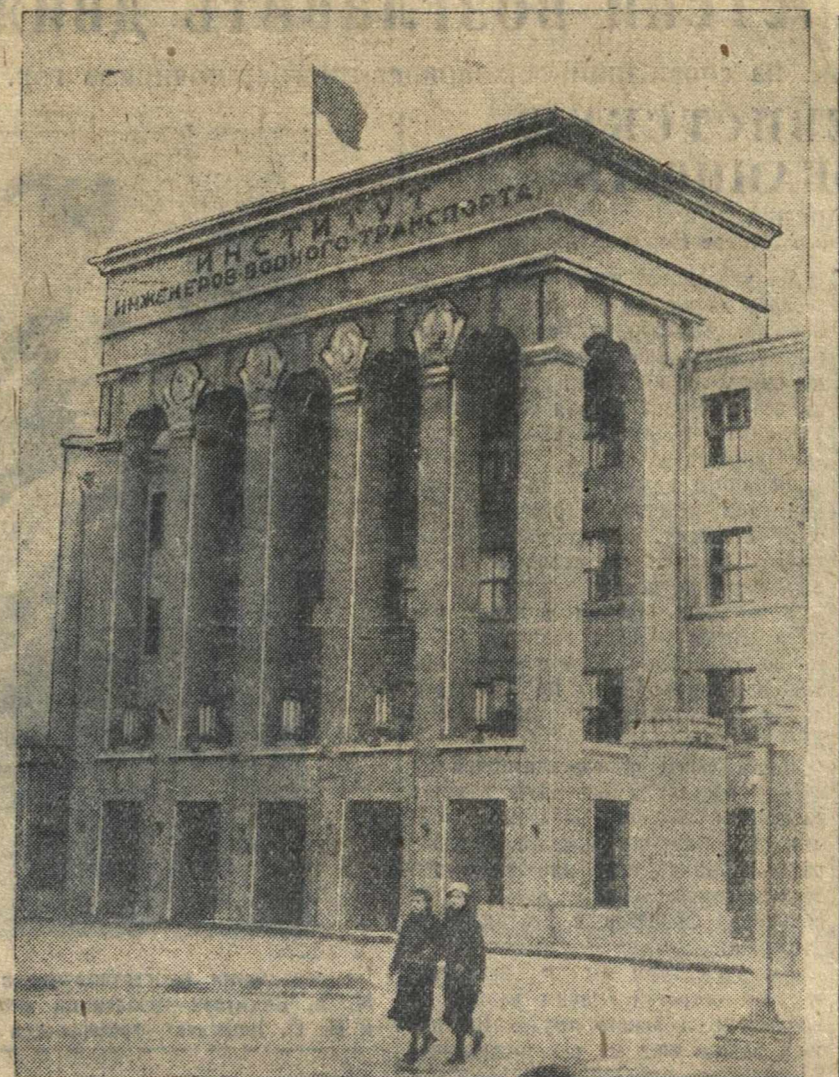
Институт инженеров водного транспорта в г. Горьком. Главный вход.

В заключение вечера артисты областного драматического театра т. Бельская и Великая прочитали отрывки из романа Чернышевского «Что делать?» и отрывки из романа Арбачевой «Чернышевский».