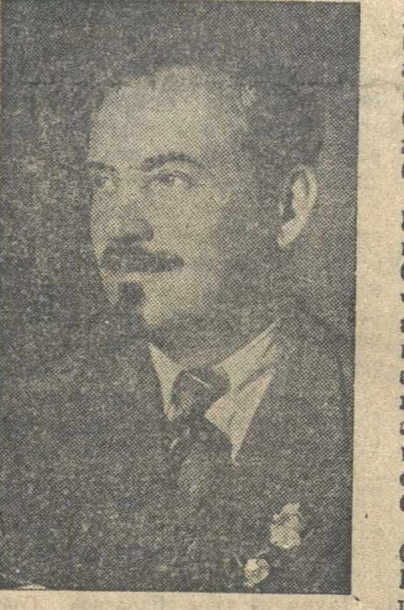
Н. А. Булганин

Западная Белоруссия стояла под ярмом польских помещиков и капиталистов. Польские паны ввергли Западную Белоруссию в нечеловеческие беды. Устлая тора, пыльный убор и тяжелое горе были уделом западно-белорусского трудового народа. В дни, когда Польское государство распалось и Польша стала удобной почвой для всяких случайностей и неожиданностей, могущих создать угрозу для Советского Союза, когда украинцы и белорусы были брошены на волю случая, Советское Правительство послало своей обязанностью подать руку помощи своим единокровным братьям — украинцам и белорусам. Советское Правительство 17 сентября 1939 года отдало приказ командования Красной Армии взять под защиту жизнь и имущество населения Западной Белоруссии и Западной Украины. Красная Армия по воцелительством своих славных командиров вступи-