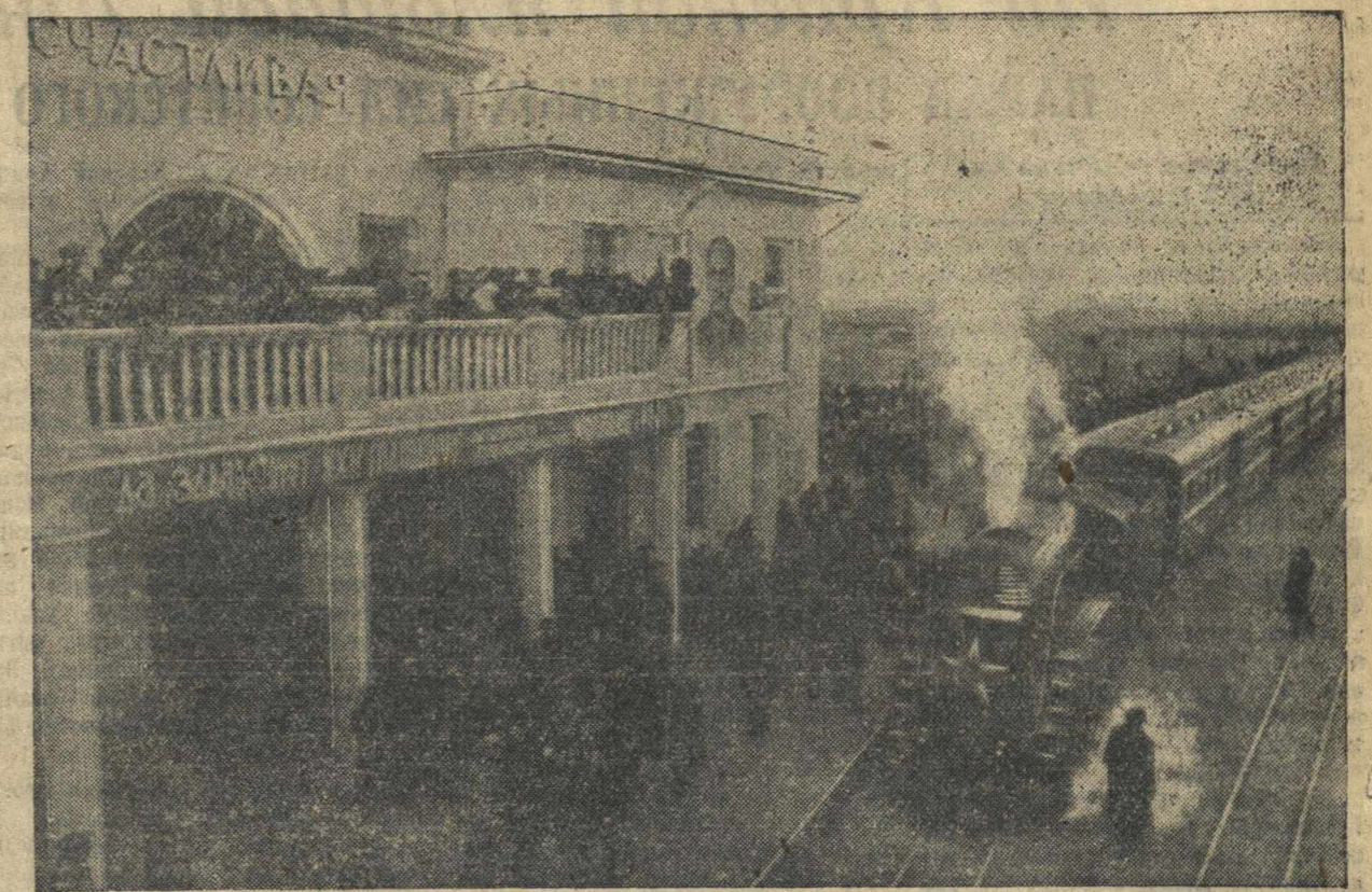
8 ноября открылась детская железная дорога им. Горького. На снимке: первый поезд пришел на станцию «Счастливая».

И в каждой колонне можно было видеть плакаты и макеты, посвященные выборам в местные Советы депутатов трудящихся. Каждая колонна ярко выражала благородные стремления и патристические чувства наших граждан.