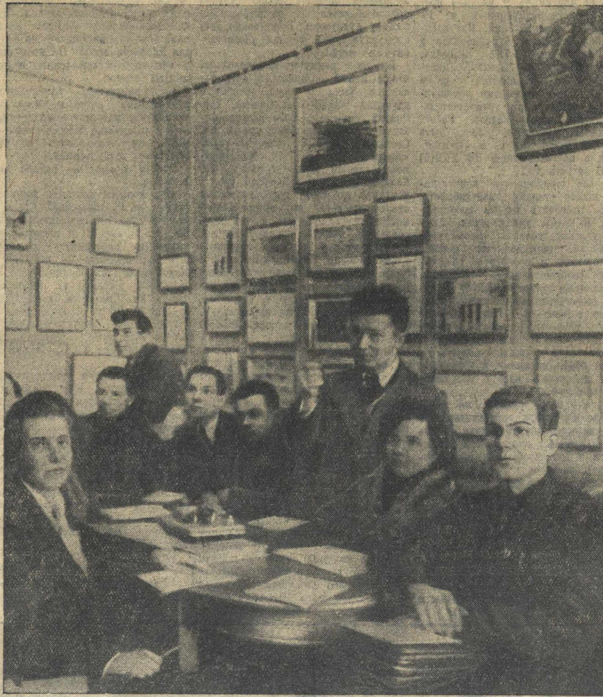
В Дома партийного просвещения обкома и горкома ВКП(б). Группа изучающих историю ВКП(б) в кабинете, посвященном VI главе «Братского курса истории ВКП(б)».