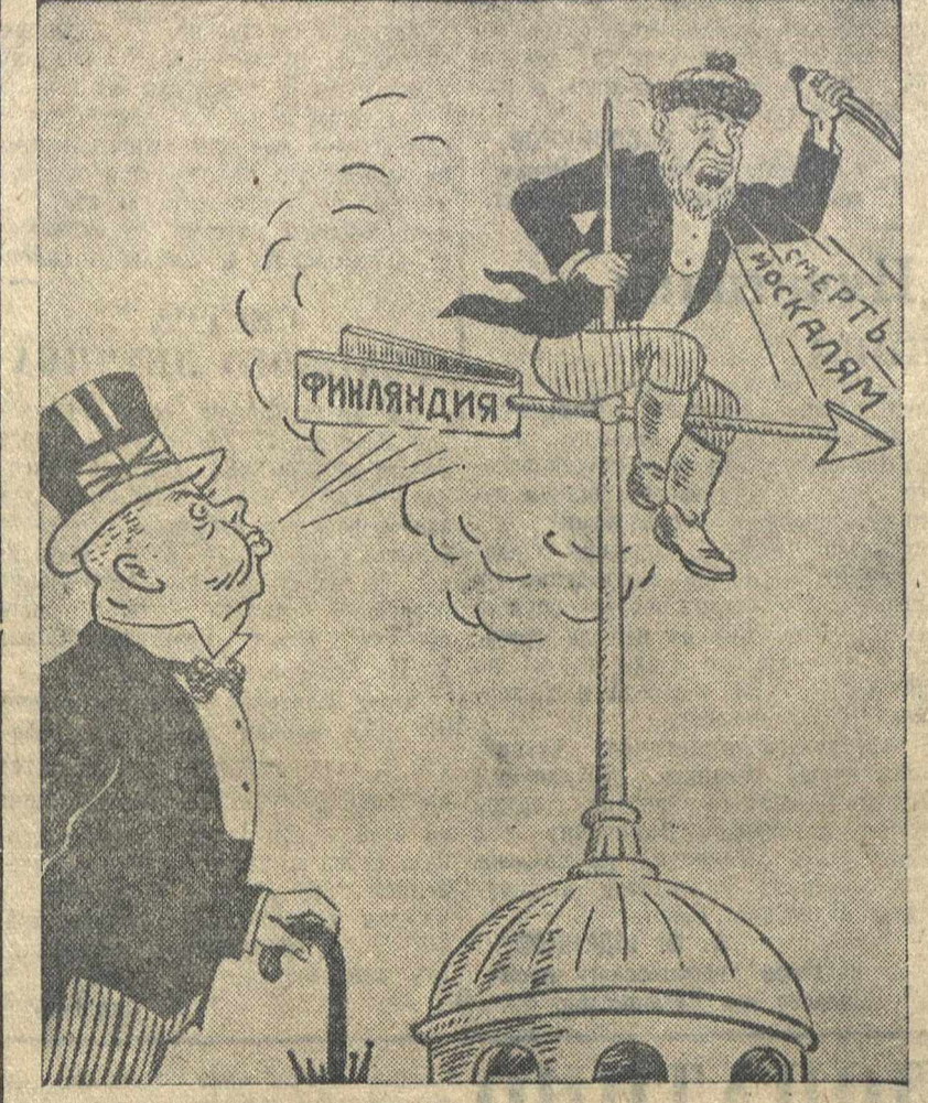
ОТКУДА ВЕТЕР ДУЕТ. Рис. В. Шмелева. (ТАСС).

Делегат Мексиканского Ломбардо Толедано настаивал в своей речи на том, чтобы американские рабочие проте-