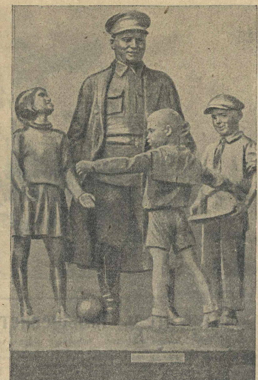
Скульптурная группа «С. М. Киров среди детей».