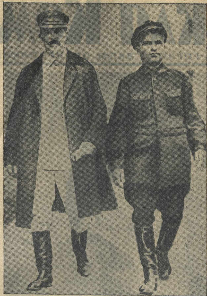
И. В. Сталин и С. М. Киров в Кремле.