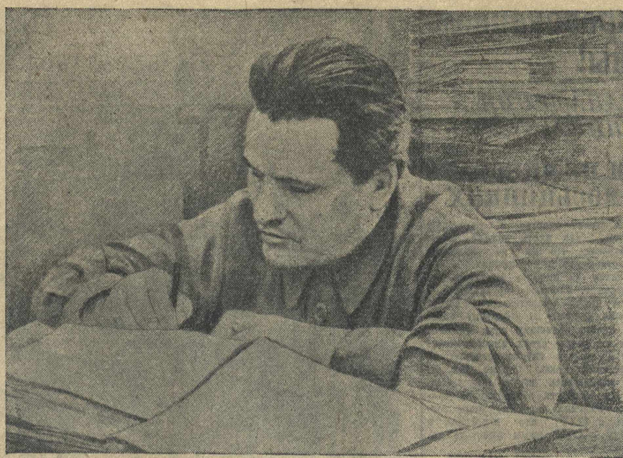
С. М. Киров за работой.