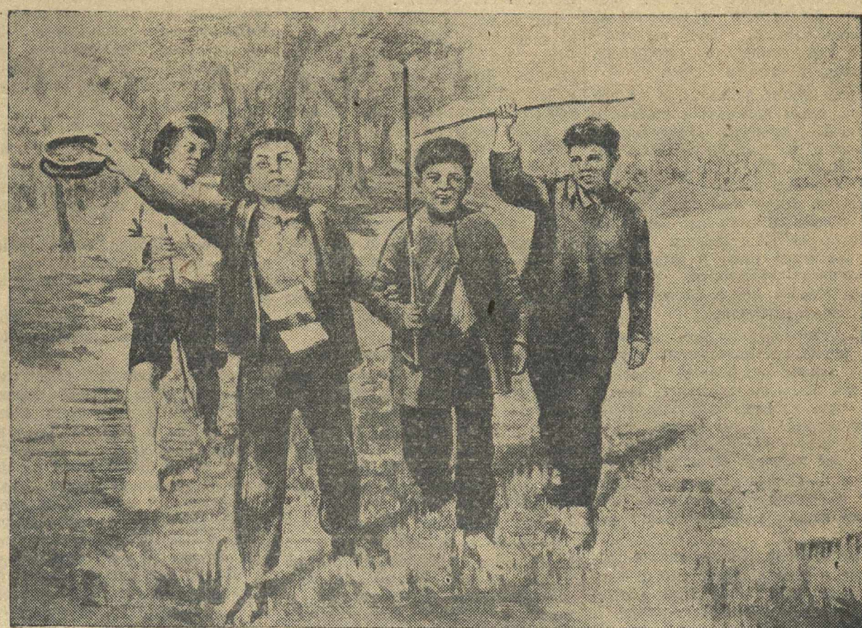
СТАЛИН В ДЕТСТВЕ.

На языках национальностей, проживающих в основной своей массе за пределами СССР, произведения И. В. Сталина изданы тиражом более чем в 1,9 миллиона экземпляров. (ТАСС).