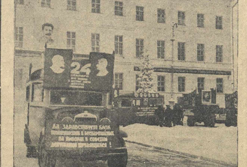
14 декабря в районы области отпраздновали семь агитбригад по выборам в местные Советы депутатов трудящихся.

Открытие предварительная продажа билетов в районной театальной кассе: с 11 ч. до 9 ч. а с 21 ч. — в кассе театра оперы и балета с 2 ч. до 8 ч. веч. Заявки на коллективные посещения принимаются по телефону № 3-99-29. Начало в 7 ч. 45 м. вечера.