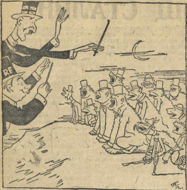
Антикоммунистический ансамбль и его дирижеры. Рис. Гр. Ставиславска.