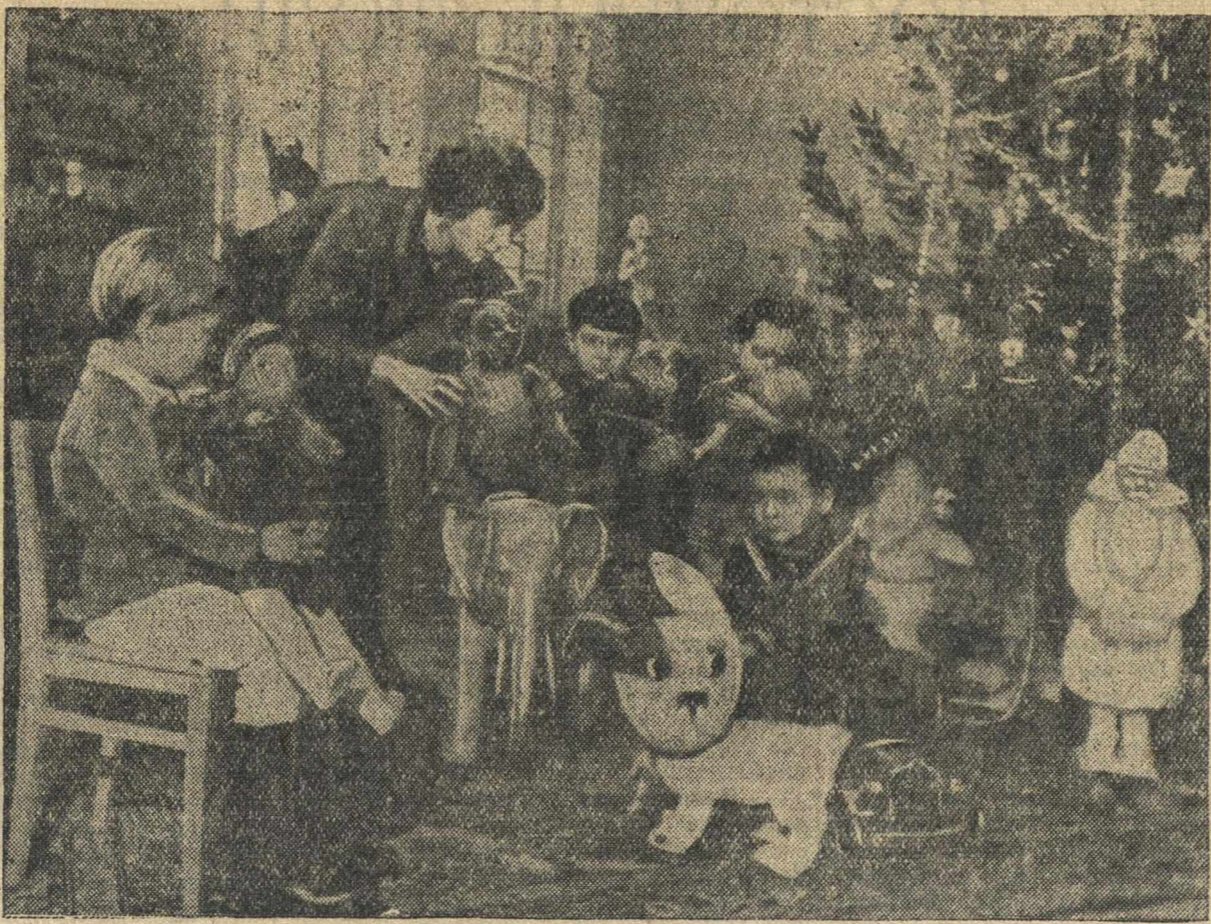
В детской комнате на избирательном участке № 100 (Ленинский район).