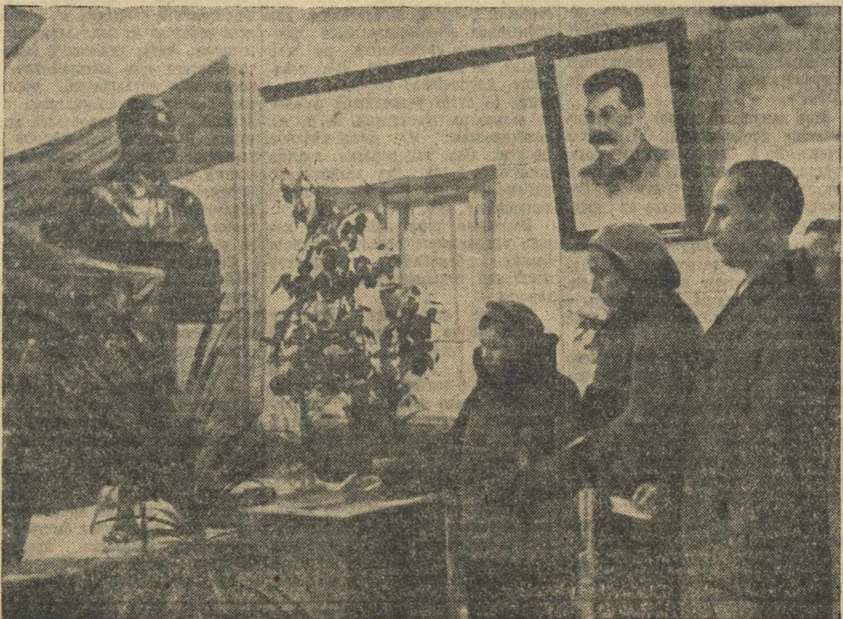
На избирательном участке № 288 Автозаводского района.