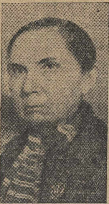
наказ, который дали ему избиратели.

Мы всегда должны помнить слова товарища Сталина, сказанные им на предвыборном собрании избирателей Сталинского избирательного округа гор. Москвы 11-го декабря 1937 года, когда он четко и ярко отметил зависимость депутата от народа, от избирателей. Товарищ Сталин сказал, что депутат — слуга народа, его посланец в Советы и должен помнить и выполнять тот