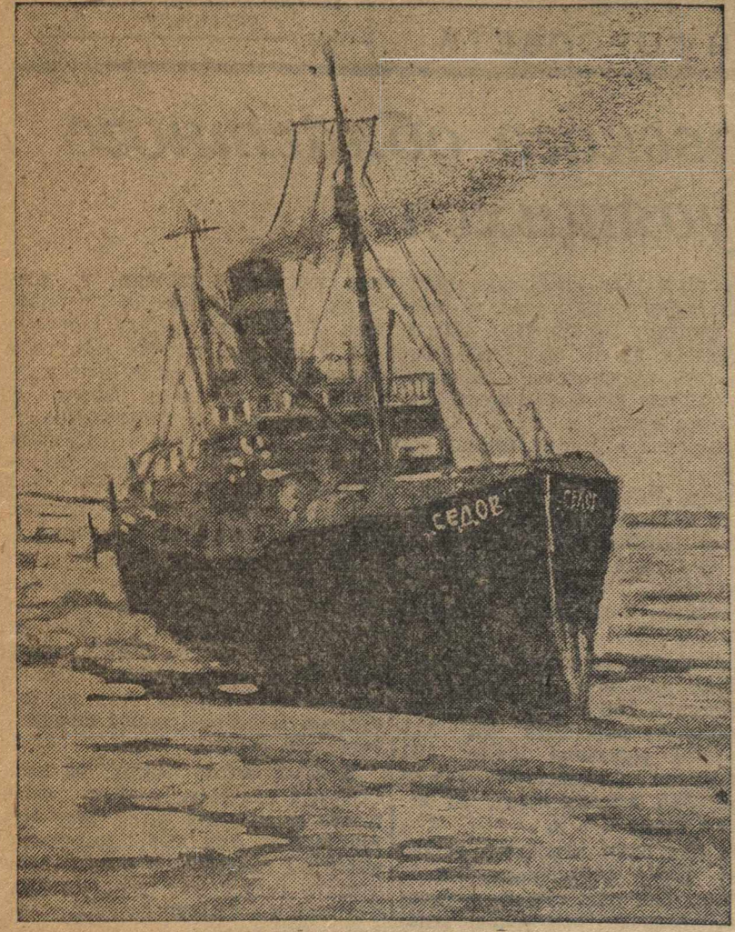
Ледокол «Седов» во льдах Северного Ледовитого океана. (Снимок сделан в августе 1938 года).

15 мужественных советских моряков покосились перед всем миром, что никакие трудности не являются преградой для большевиков. В течение 26 месяцев коварная природа Арктики на каждом шагу подстерегала советских людей. Высокое моральное состояние, дисциплинированность, сознание большой ответственности, преданность великой родине, партии, правительству, товарищу Сталину, — вот что помогло седовцам победить. (ТАСС).