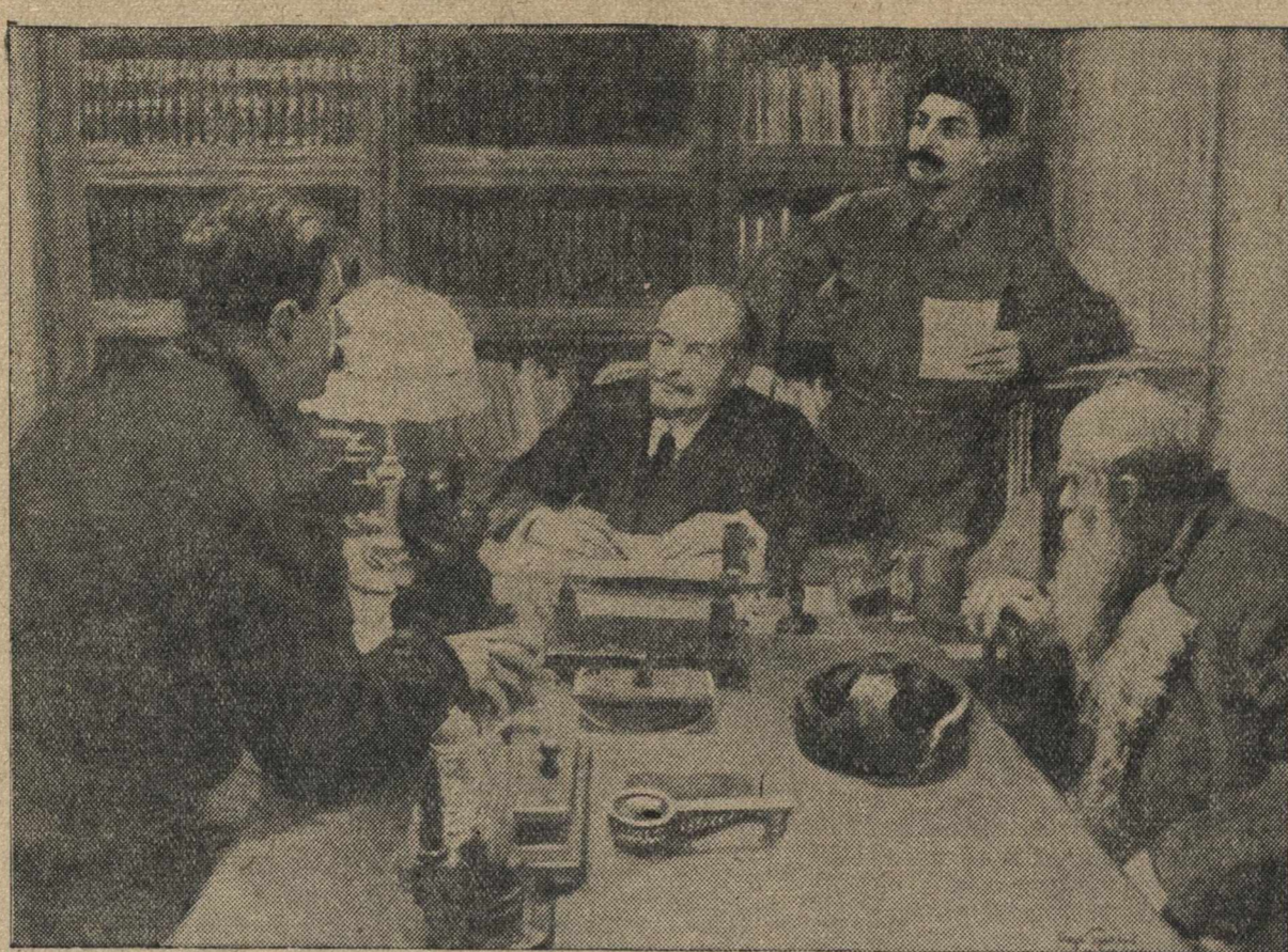
«Ходки крестьяне на приеме у В. И. Ленина» — репродукция с картины И. Грабаря.

Оперсводка штаба Ленинградского Военного Округа В течение 24 января на всех направлениях происходили бои разведчиков и стычки мелких пехотных частей. Наша авиация производила разведывательные полеты.