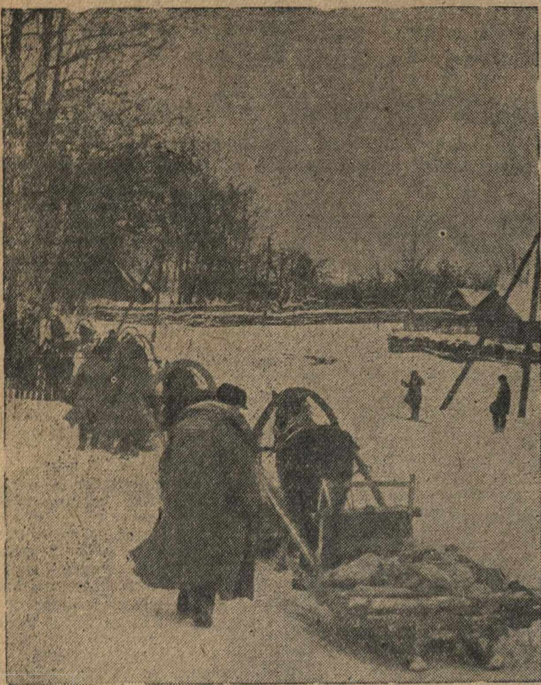
Строительство дороги Горький—Муром—Кулебаки. На снимке: колхозники колхоза «Крестыанин», Богородского района, возят камень из карьера и трассе.