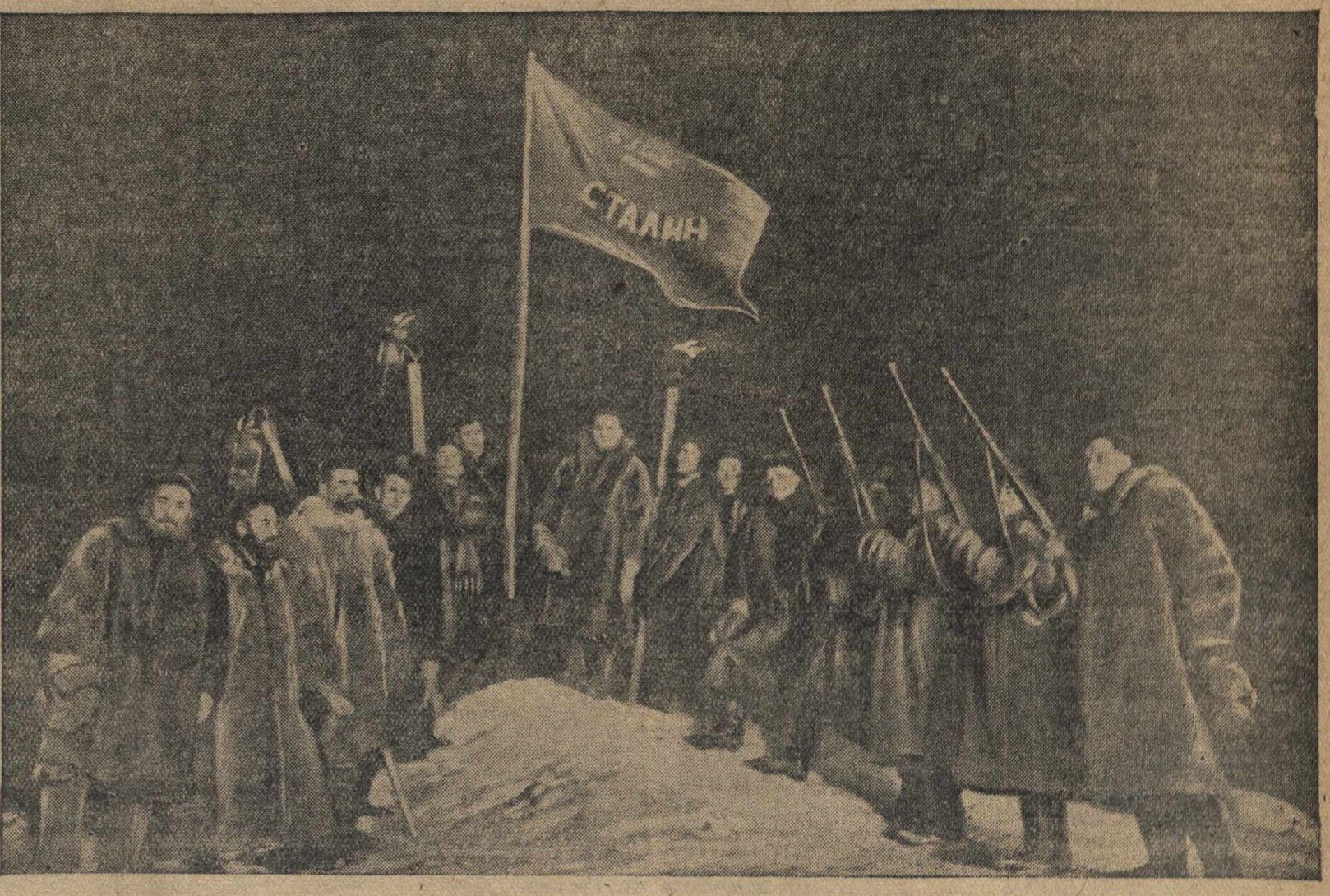
По окончании исторического дрейфа седовцы водружают на льдине флаг с именем Сталина.