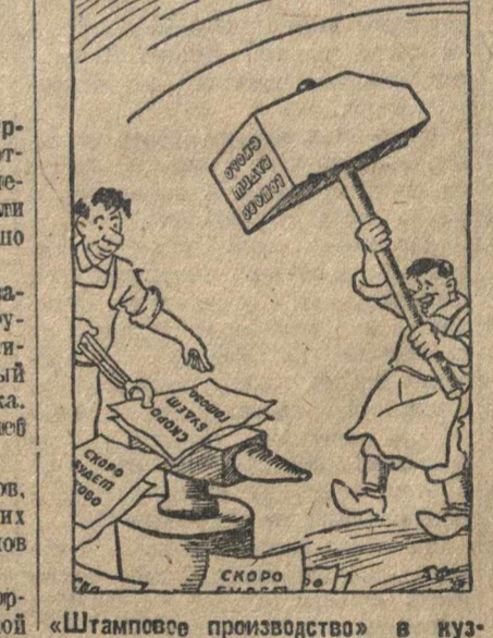
«Штамповое производство» в кузнице горметсоюза.