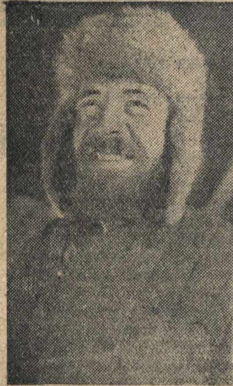
Герой Советского Союза старший помощник капитана А. Г. БОРОВОВ.