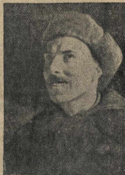
Герой Советского Союза старший механик и пилот Д. Г. ТРОФИМОВ.