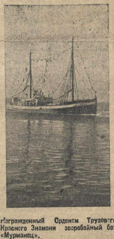
Награжденный Орденом Трудового Красного Знамени заводской бот «Мурманск».