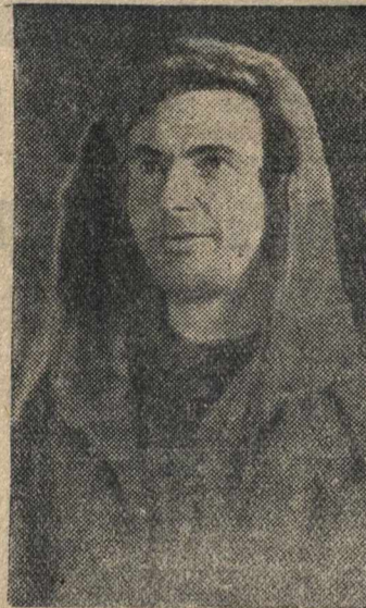
Герой Советского Союза гидрограф В. Ф. БУЙНИЦКИЙ.