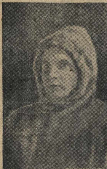
Герой Советского Союза капитан К. С. БАДИГИН.

ОРГАН ГОРЬКОВСКОГО ОБКОМА И ГОРКОМА ВКП(б), ОБЛАСТНОГО И ГОРОДСКОГО СОВЕТОВ ДЕПУТАТОВ ТРУДЯЩИХСЯ