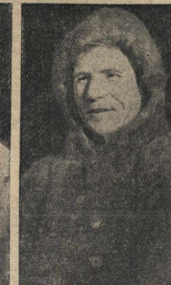
Герой Советского Союза повар И. И. ТЕТМАН.