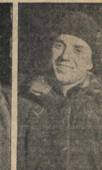
Герой Советского Союза механик И. М. НЕЛЮЖСКИЙ.