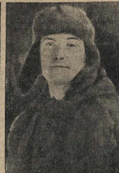
Герой Советского Союза матрос Е. И. ГАМАНКОВ.