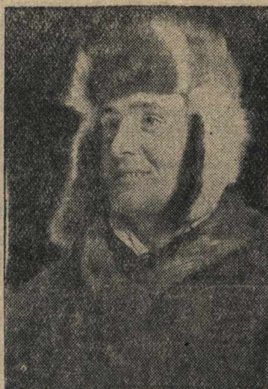
Герой Советского Союза повар П. Б. МЕГЕР.