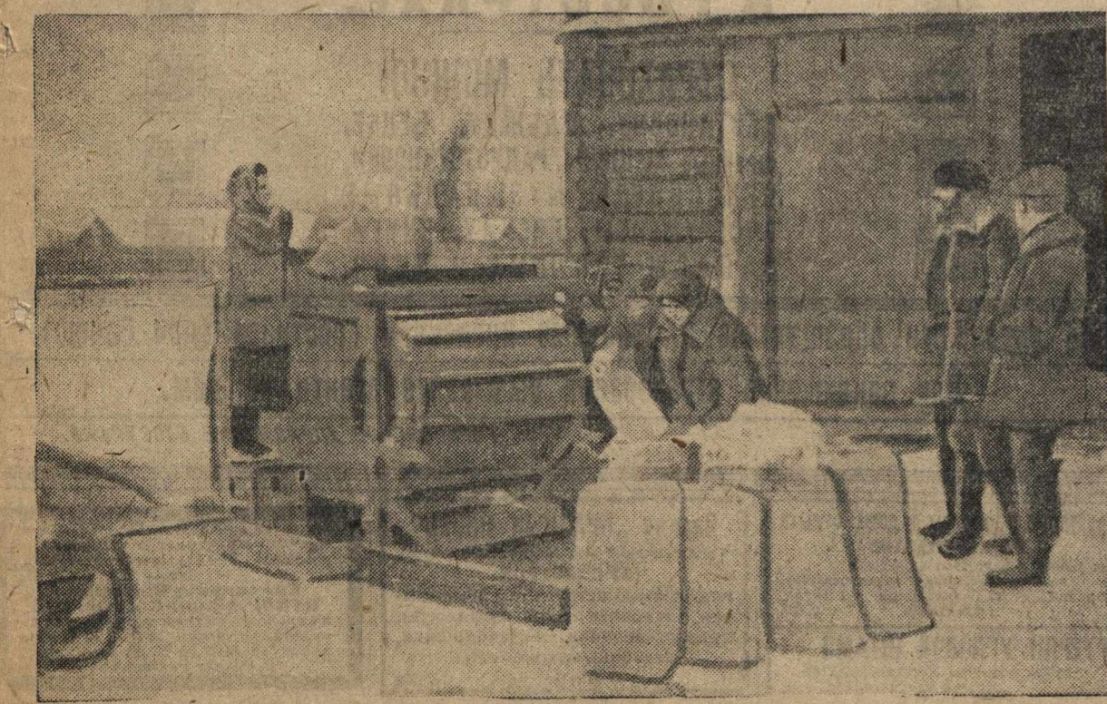
Колхоз им. Карла Маркса усиленно готовится к осеннему севу. На снимке: очистка семян у колхозного зернохранилища.

Д. ГОЛЛАНД, Болхов им. К. Маркса, Чкаловского района.