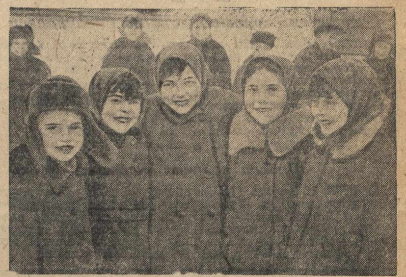
Группа детей колхозников сельскохозяйственной артели имени Карла Маркса—ученики начальной школы.

След не пройдет и мимо вопроса о рости постоянных звеньев в производственной жизни артели. При пересмотре Устава будет, несомненно, выделен специальный пункт о звеньях. Чрезвычайно важно будет записать в Уставе, что так же, как и полеводческая бригада, постоянные звено выделяется на срок не менее полного севооборота и что участки ему отводятся в полях севооборота на срок севооборота. Это неизмеримо повысит ответственность как звеньевых, так и членов звена за судьбу урожая, углубит их знания полей, поможет лучше проследить действие и последствия различных удобрений и агротехник.