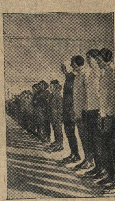
Участники Всесоюзных коннобразных соревнований на первенство ВЦСПС на параде.