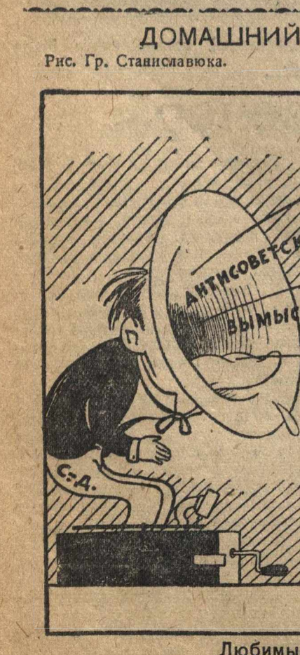
Рис. Гр. Станиславкова.