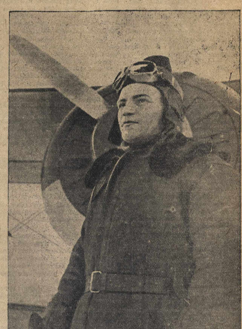
Капитан Краснознаменного Балтийского Флота П. Г. Артемьев, награжденный орденом «Красное Знамя» за образцовое выполнение боевых заданий Командования на фронте борьбы с финской белогвардейщиной.

Сборник «Гражданская война в СССР в документах» выйдет в 1 мая. Он является ценным пособием для изучающих «Братский курс истории ВКП(б)» и историю СССР. (ТАСС).