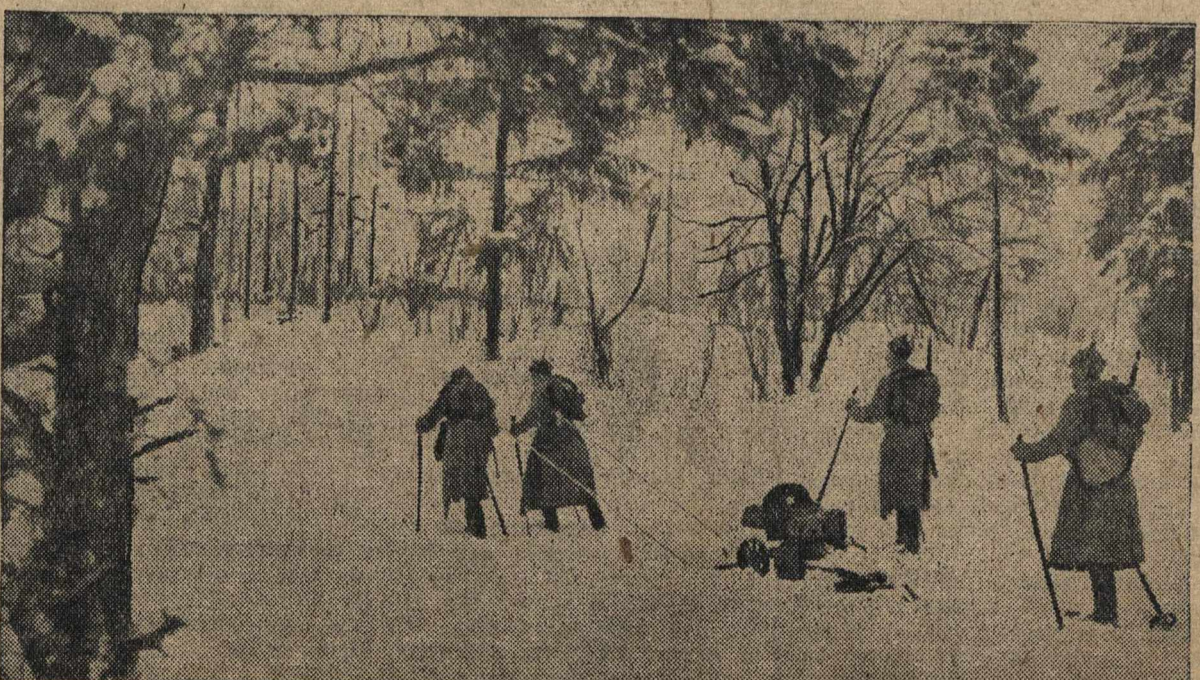
Лыжники-пулеметчики Н-ной части ВКП на тактических занятиях.

В результате Лысковский и Залесный райкомы ВКП(б) плохо справляются