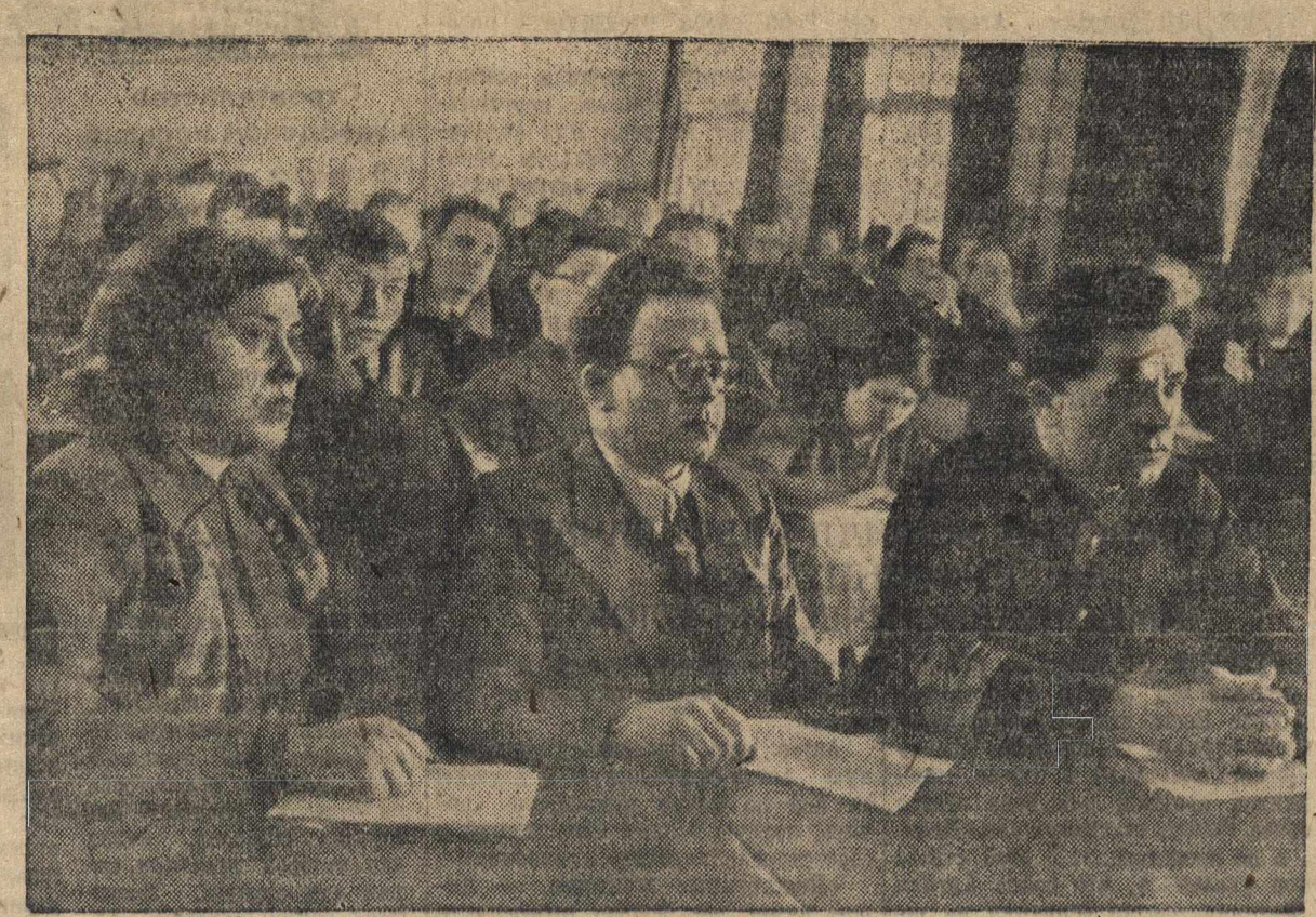
На отчетно-выборном собрании партийной организации Горьковского института инженеров водного транспорта.

Партия большевиков через комсомол осуществляет руководство молодежью и воспитывает молодое поколение в духе коммунизма. На XVIII съезде партии, в докладе об изменениях в уставе ВКП(б) тов. Жданов