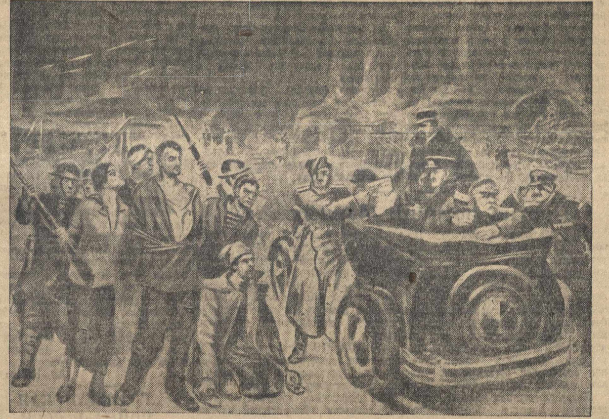
«ИНТЕРВЕНЦИЯ НА СЕВЕРЕ». (Картина художника П. Соколова-Скаля).

Разгром под Шенкурском отброшенный интервентов на 90 километров севернее прежней линии фронта, отрезавшее действовал на солдат интервенционистской армии. Недовольные своим положением солдаты отказывались воевать, участвовали случаи самовольного ухода с позиций. Дело окончилось тем, что американское командование вынуждено было посадить своих солдат на суда и отправить домой, в Америку. Красные армии Северного фронта укрепились. В них вливались новые, свежие силы. Посланные партии — большевистские комиссары поднимали боеиспособность частей, неослабно вели политическую работу среди бойцов и гражданского населения.