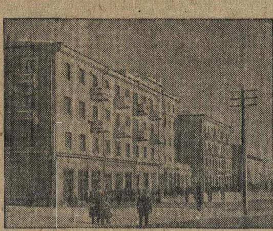
На Перекопский улице поселка Станиславова (Ленинский район).

Город Павлов на Оке является родиной крупнейшего ученого нашей страны химика-органика академика Алексея Евграфовича Фаворского. На днях Указом Президиума Верховного Совета СССР А. Е. Фаворский в связи с 80-летием со дня рождения и 55-летием научно-педагогической деятельности награжден орденом Трудового Красного Знамени.