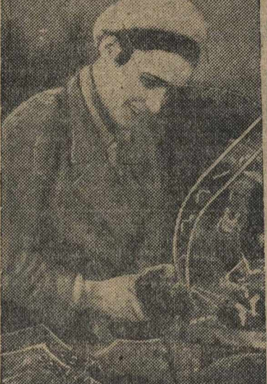
Стахановцы фабрики «Красный Октябрь» успешно борются за увеличение производительности.