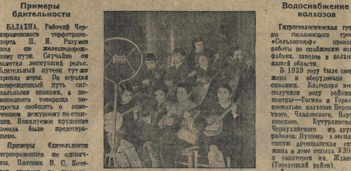
В Арзамасской районности часто выступают учителя музыкальной школы. На снимке: ребята выступают перед микрофоном.