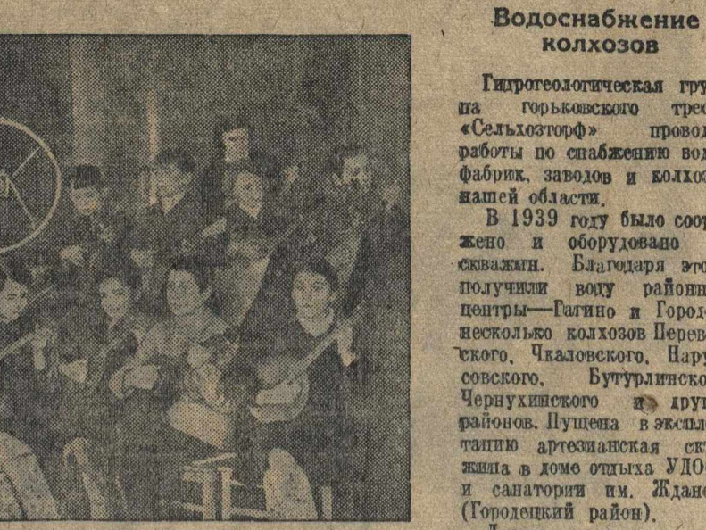
В Арзамасской районности часто выступают учителя музыкальной школы. На снимке: ребята выступают перед микрофоном.