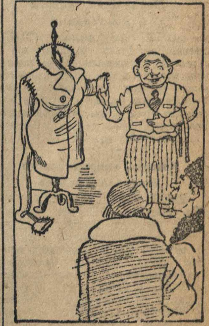
Рис. Гр. Станиславюта.