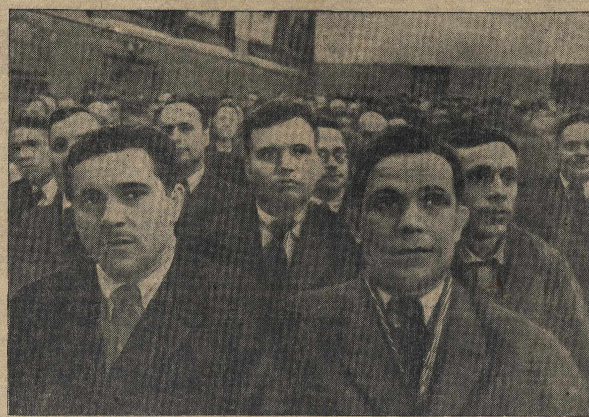
На V автозаводской районной партийной конференции.

Советский Союз, в котором тыл и фронт — неразрывно слитые части единого целого, смотрит вперед оптимистично и уверенно. Непобедима та армия, за которой стоит весь народ. Непобедима та страна, которая так монолитна!