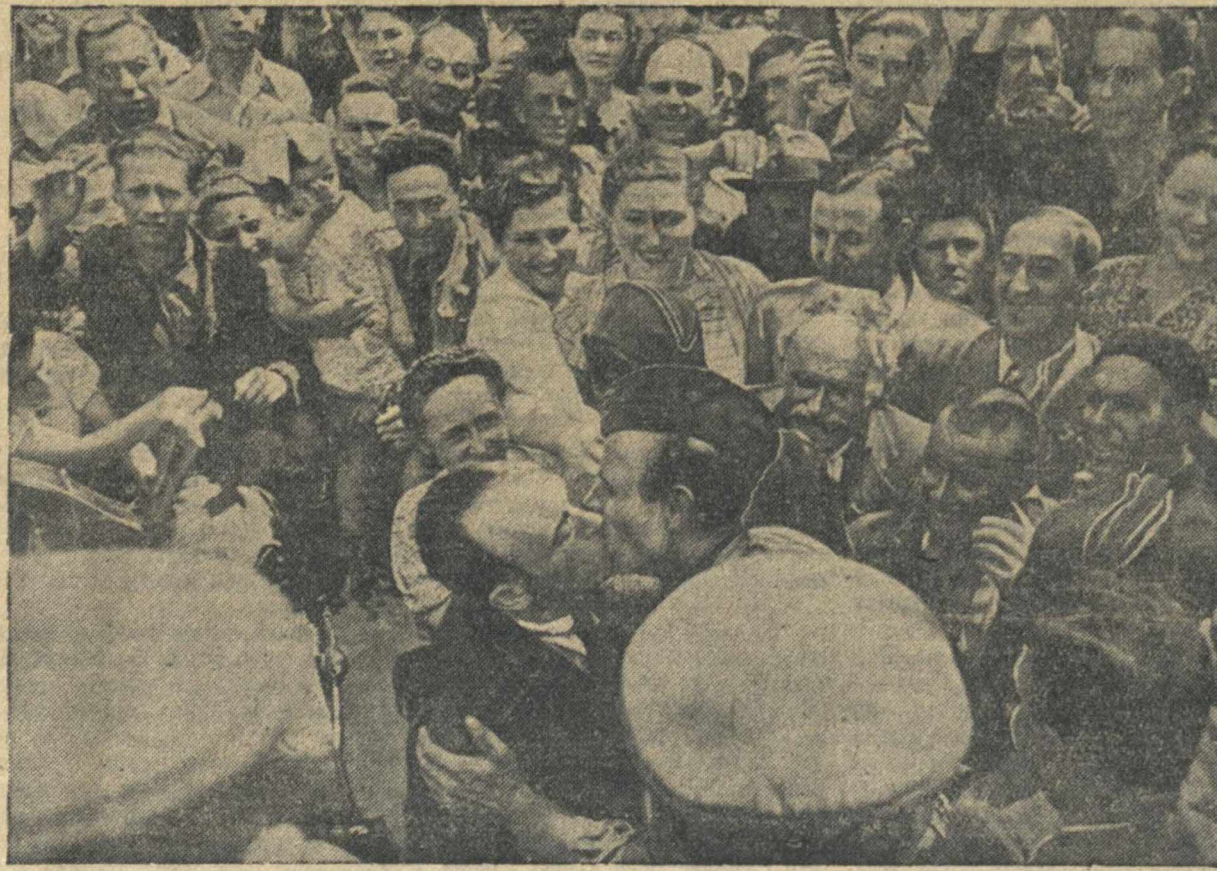
Встреча частей Красной Армии населением Кишинева (Бессарабия).