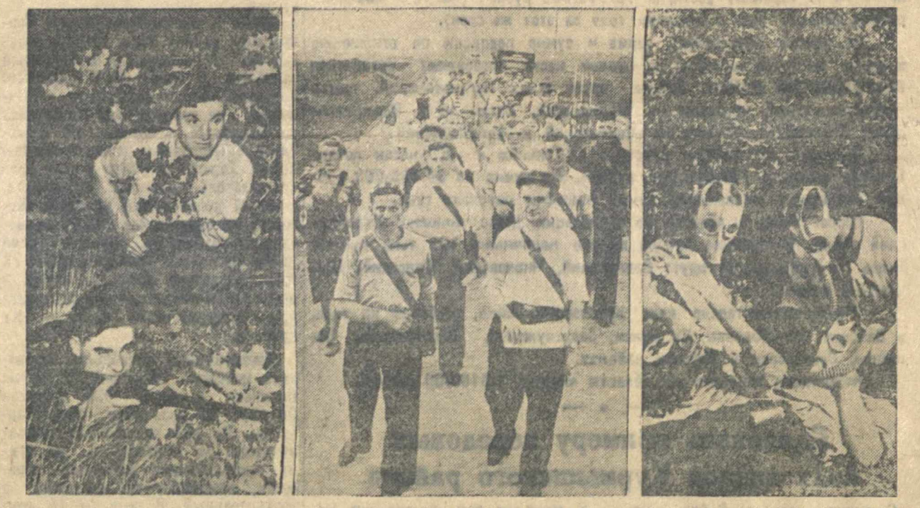
Автозаводский районный комитет ВЛНСМ и райсовет Осоавиахима регулярно проводят военизированные походы молодежи. На снимках отдельные моменты военизированного похода молодежи цеха технического контроля. Слева направо: на передовой линии, колонна в походе и оказание первой помощи.