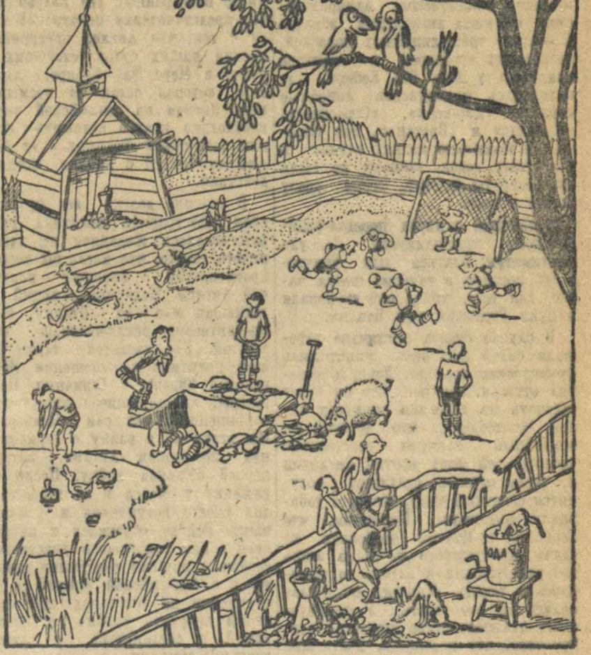
— Удивляюсь, как они здесь бегают? Над этим стадионом давно летать трудно, очень уж воздух тяжелый от загрязнения.