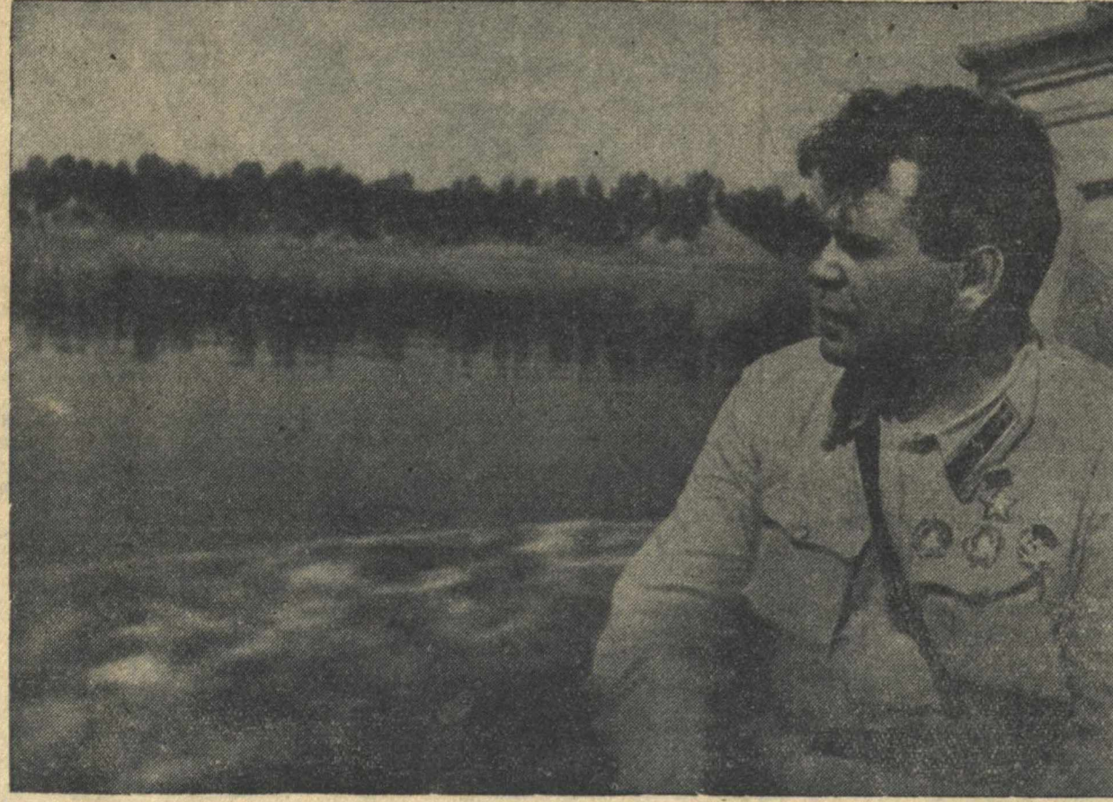
На днях г. Горький посетил Герой Советского Союза М. В. Водопьянов. На снимке: М. В. Водопьянов на пути в Чкаловск.