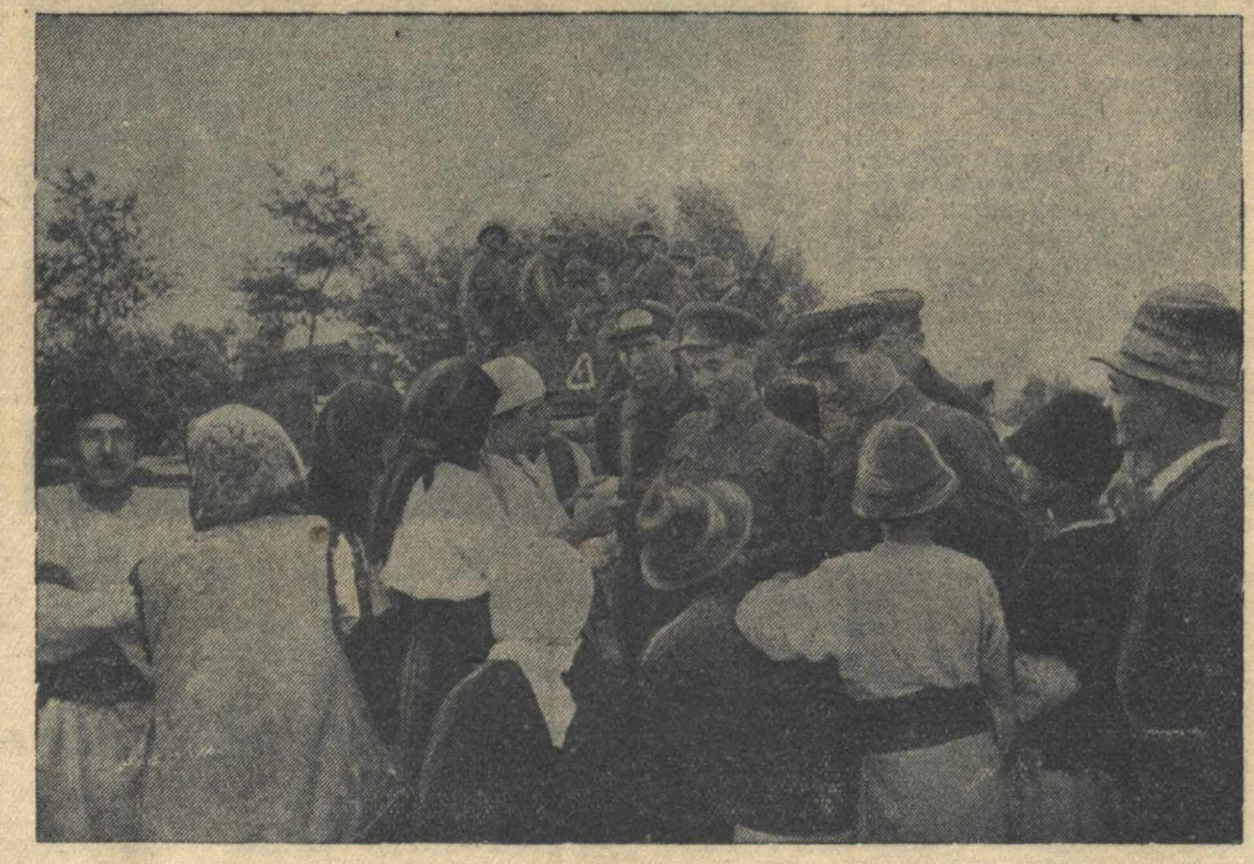
Северная Буковина. На снимке: бойцы Красной Армии беседуют с населением на бывшей румынской границе.