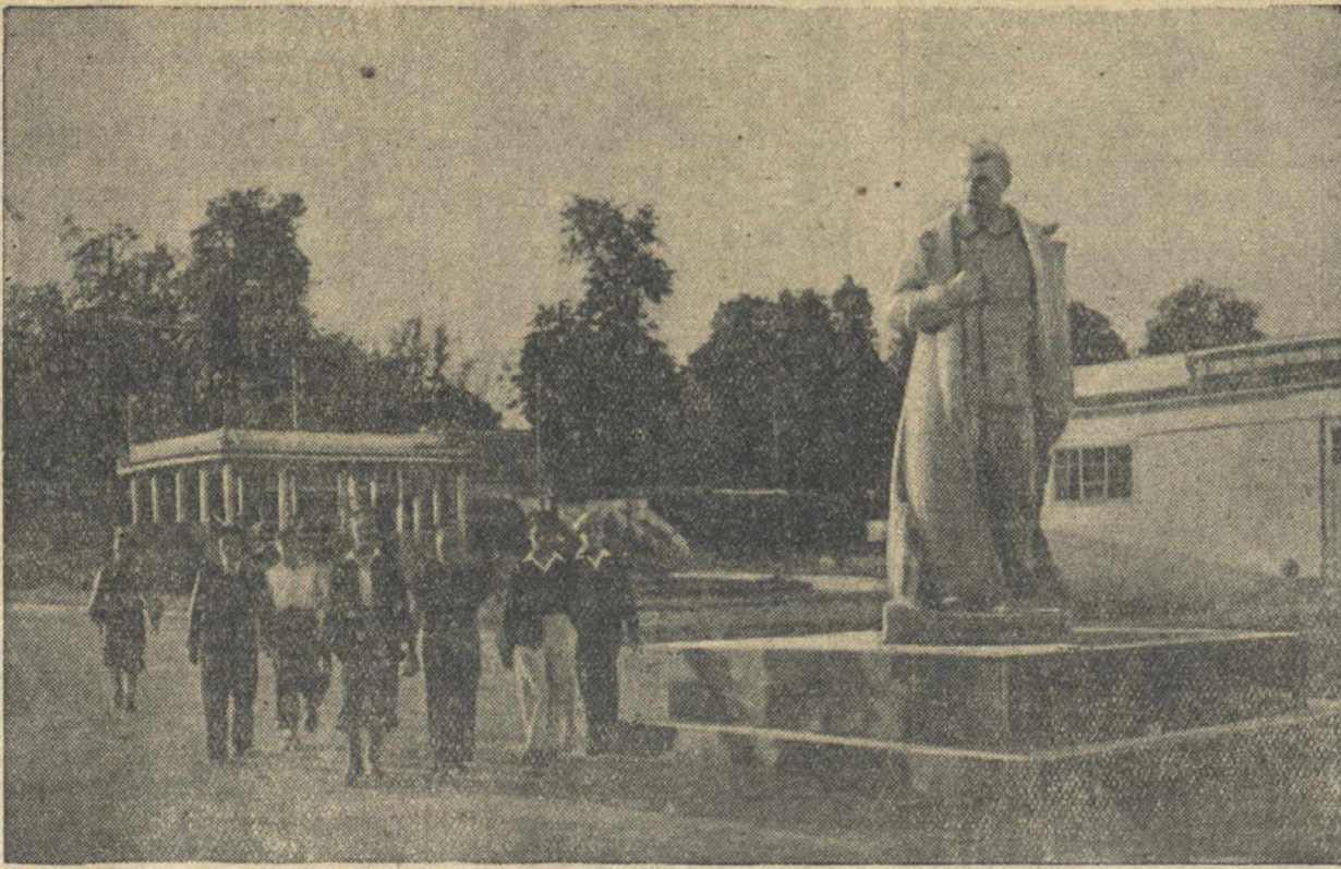
В новом парке культуры и отдыха в Пинске (Белорусская ССР).

В Астрахани началась подготовка к 16 тиражу займа Второй пятилетки (выпуск четвертого года), который состоится 17 и 18 июля. 1.210 тысяч выигравшей на сумму 196.420.000 рублей.