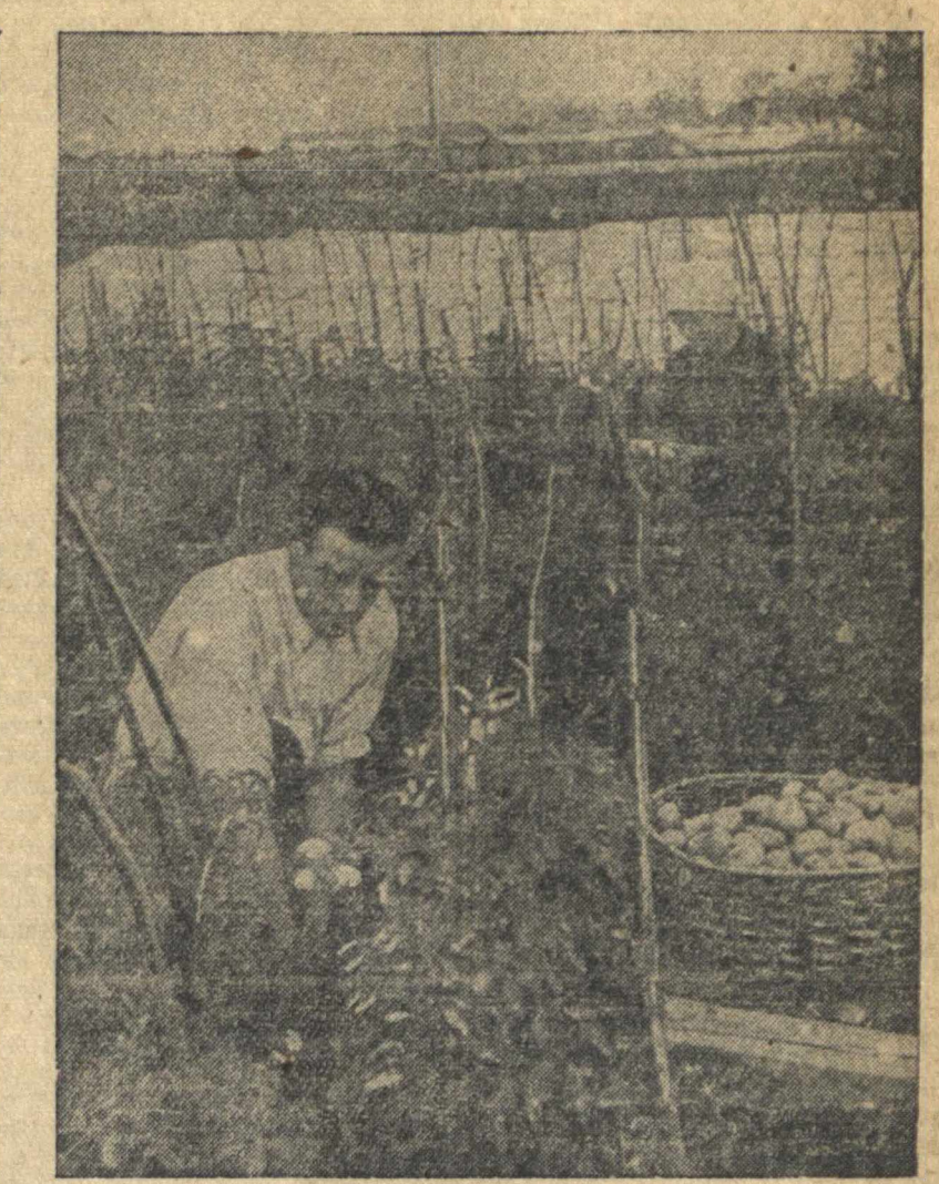
На днях Почерский колхоз им. Калинина сдал торгующим организациям первые 100 килограммов помидоров нового урожая. На снимке: сбор помидоров в колхозе им. Калинина.