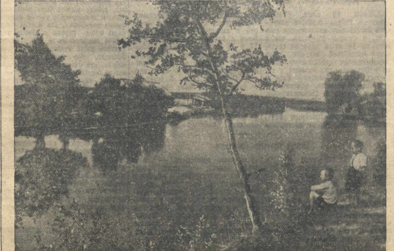
Прекрасный пруд имеет колхоз «Согласие», Чилаловского района. На снимке: вид части пруда.

П. Метельнов, пом. начальника Станкожестрой.