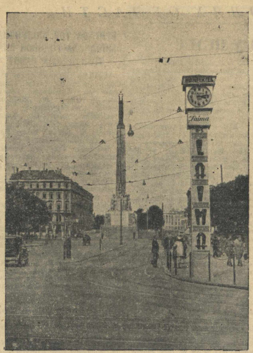
Центральная площадь г. Риги (Латвия).

КАУНАС, 15 июля. (ТАСС). Особым указом литовского правительства закрыты «Союз стрелков» («шаулисты»), одна из опор штемпельного режима, принимавший участие в подавлении забастовок, разгоне демонстраций и т. п. В состав союза входили преимущественно сме-