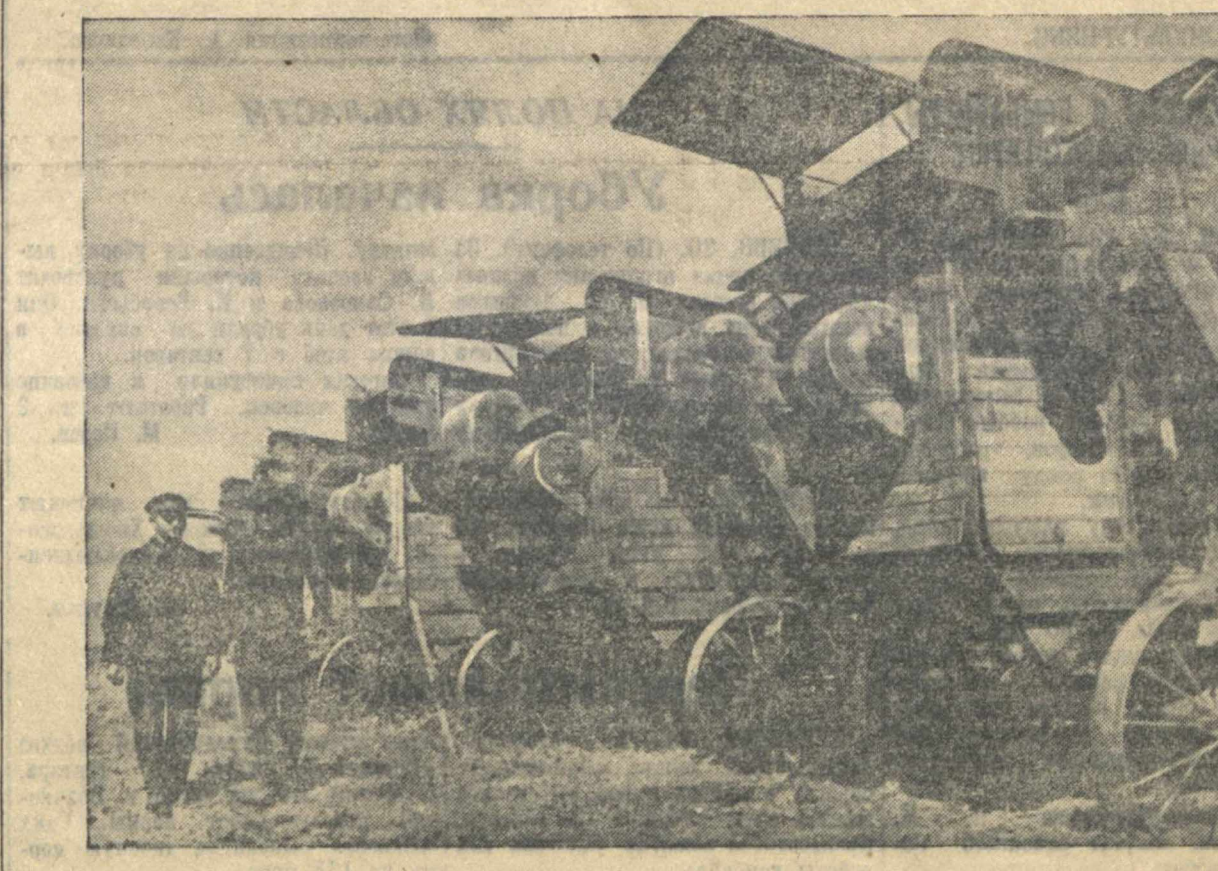
Салганская МТС. На снимке: Отремонтированные молотилки, готовые к отправке в колхозы.