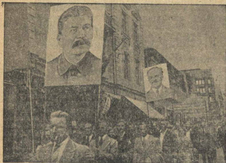
Население Риги организовано на правительственных участках.