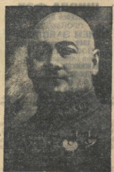
Пашет крыжон сизокрыный Над водой днестровской, Ходит слава над мостями, Где лежит Котовский... Эдуард Багрийич.