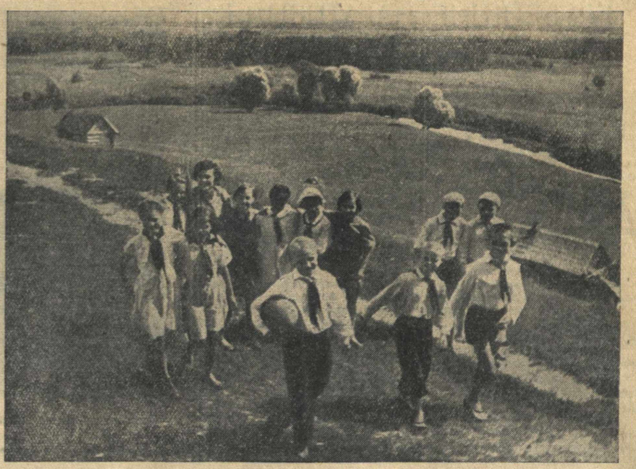
Хорошо отдохнули 167 ребят Чкаловского района в своем пионерском лагере. На снимке: пионеры возвращаются с волейбольной площадки.