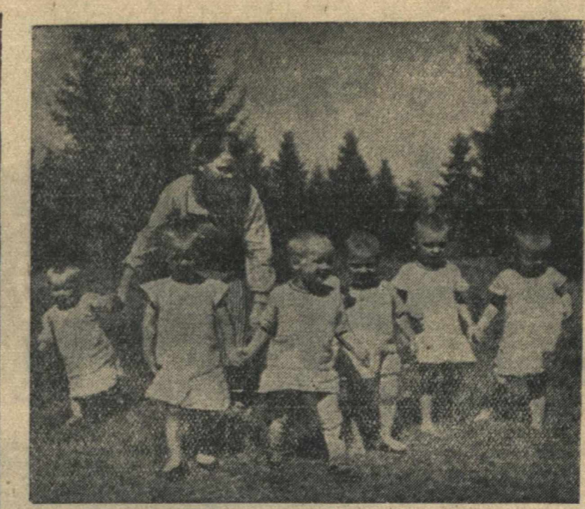
Дети на групповом фото «12 Октября», Горьковского района. На снимке: группа ребят на прогулке.