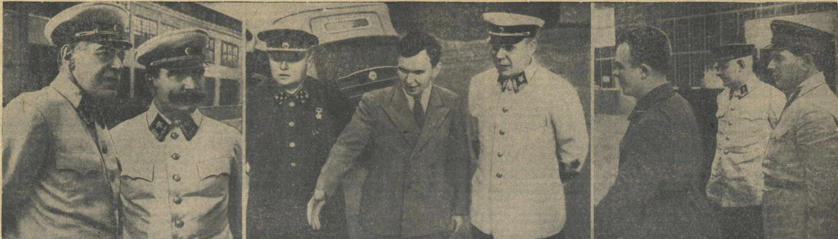
На днях гор. Горький посетили Народный Комиссар обороны Маршал Советского Союза С. К. Тимошенко, заместители Народного Комиссара обороны Маршалы Советского Союза С. М. Буденный, Г. И. Кулик, Б. М. Шапошников, армейский комиссар 1-го ранга Л. З. Мехлис и начальник Генерального штаба Красной Армии генерал армии К. А. Мерецков. На снимках (слева направо): гг. Б. М. Шапошников, С. М. Буденный, К. А. Мерецков, директор автозавода И. К. Лоскутов, С. К. Тимошенко, секретарь обкома ВКП(б) М. И. Родионов, Г. И. Кулик и Л. З. Мехлис—на автозаводе им. Молотова.

1 мес.—2 руб. 50 коп., на 3 мес.—7 руб. 50 коп. Подписка принимается помесячно, с оплатой в течение 13 чисел. Объявления принимаются с 13 час. утра до 16 час.