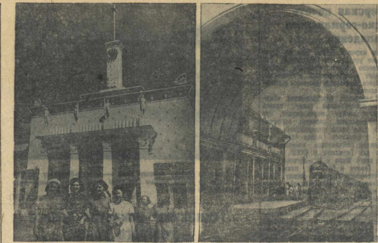
На станции «Счастливая» Горьковской детской железной дороги им. Горького.

Оценивая резко отрицательно современное ему капиталистическое общество, Горький не только избачивал лиц пустых, самодовольных и дичишких, но неоднократно показывал и людей, пассивно противостоящих грубой социальной дей-