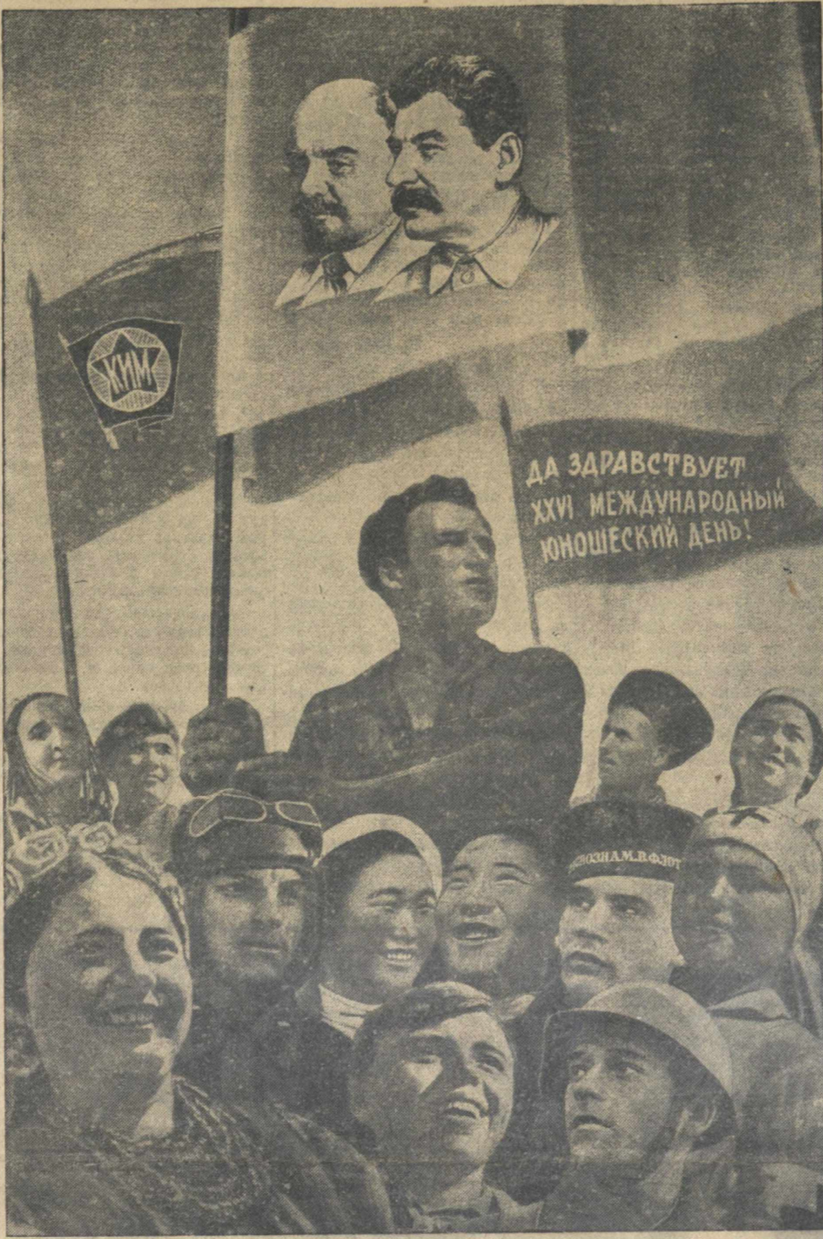
ФОТОМОНТАЖ Гр. СТАНИСЛАВЮКА.

Участники пленума приняли приветственное письмо товарищу Сталину.