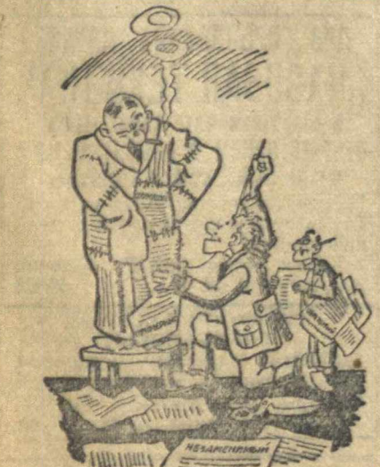
Одеяла, шитая белыми нитками. Рис. Гр. Станиславска.

Когда этим правилом пренебрегают, случается то, что случилось в промторге. МИХ. ПОЛОНСКИЙ.