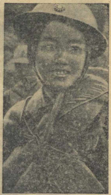
Гуансийская девушка — боец Народной китайской армии.

Вчера впервые за все время дневных налетов на Лондон голы жителей города могли наблюдать за происходящими на большой высоте боями авиации.