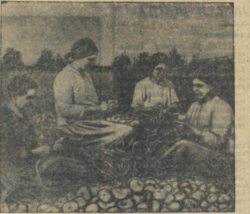
На месте бывшего болота в колхозе «Земледелец», Шахунского района, создан общественный огород. На снимке: колхозницы за обрезкой лука, собранного с нового огорода.

Область следовало бы в 2—3 колхозах организовать демонстрационный ремонт плотин и водоебов.