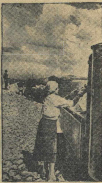
15 газогенераторных машин работают на подвозке камня от станции «Металлист» на участке дороги Горький—Муром—Кубовки в Сосновском районе. На снимке: погрузка камня.

БЕРЛИН, 11 сентября. (ТАСС). Германское информационное бюро, ссылаясь на сообщение, полученное из Випси, передает, что французское правительство ассигновало 500 млн. франков на восстановительные работы. Половина этой суммы будет израсходована в неоккупированной части Франции и другая половина — в оккупированной. Предусматривается прокладка водопроводов, канализаций, ремонт электросети, железнодорожных линий, дорог и т. д.