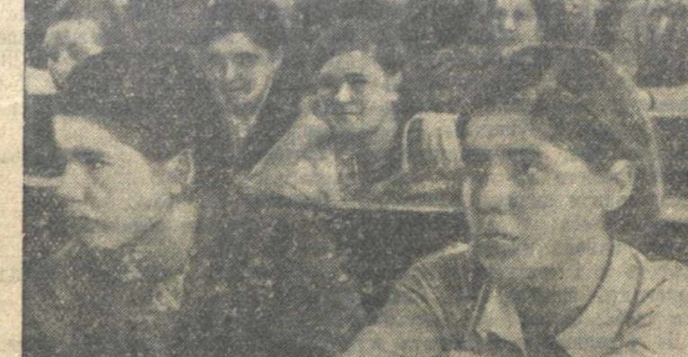
Отчетно-выборное собрание комсомольской организации конструкторского отдела орденоносного завода «Красное Сормово».

В 32 комсомольских организациях в Бутурлинском районе состоялись отчетно-выборные собрания. Комсомольцы приняли активное участие в обсуждении работы своих организаций.