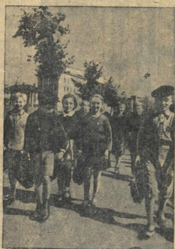
Ученики начальной школы № 79 Сормовского района идут на занятия.

На строительство дорог и тротуаров в нынешнем году затрачивается более 2 миллионов рублей.