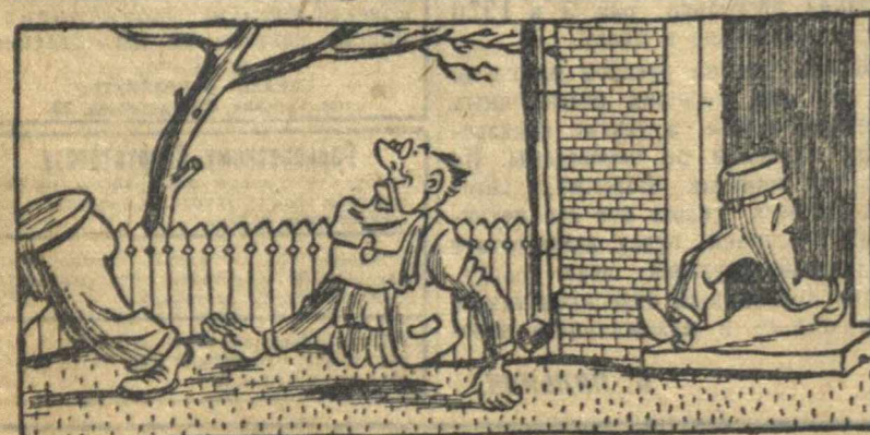
в остальное там.